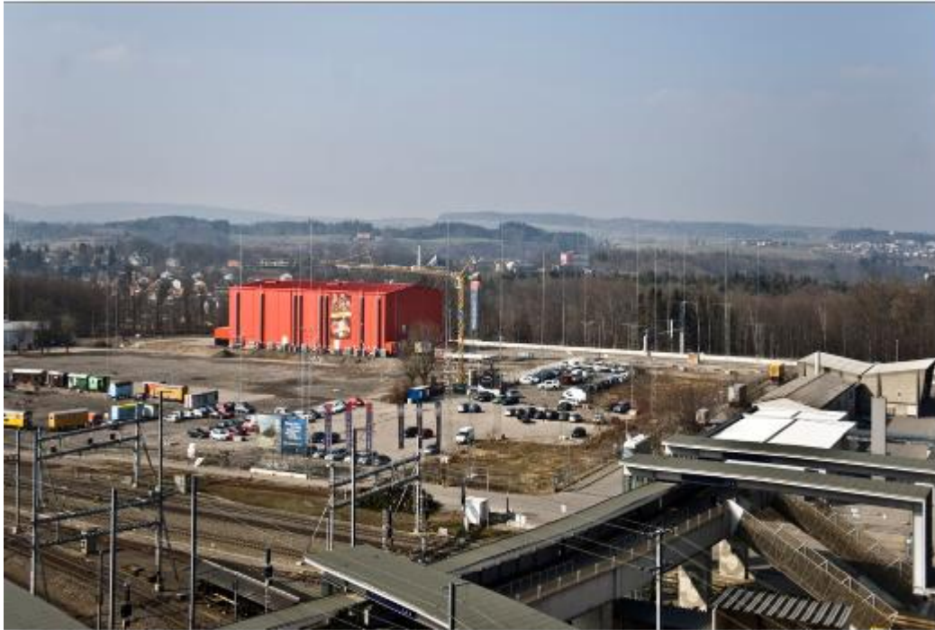
Überblick Areal, vorher.