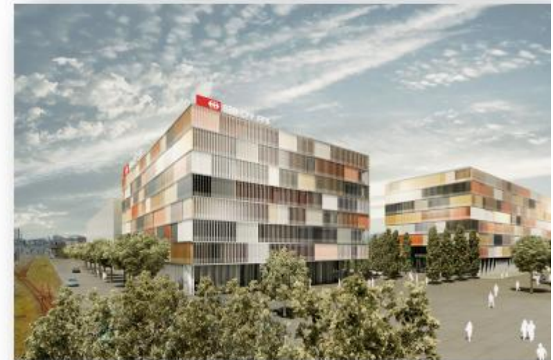
SBB Bürogebäude: Atriumbau und Längsbau.