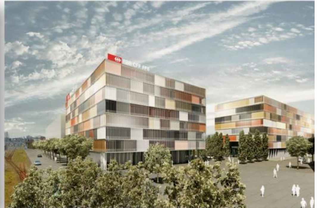
Überblick Areal, nachher.