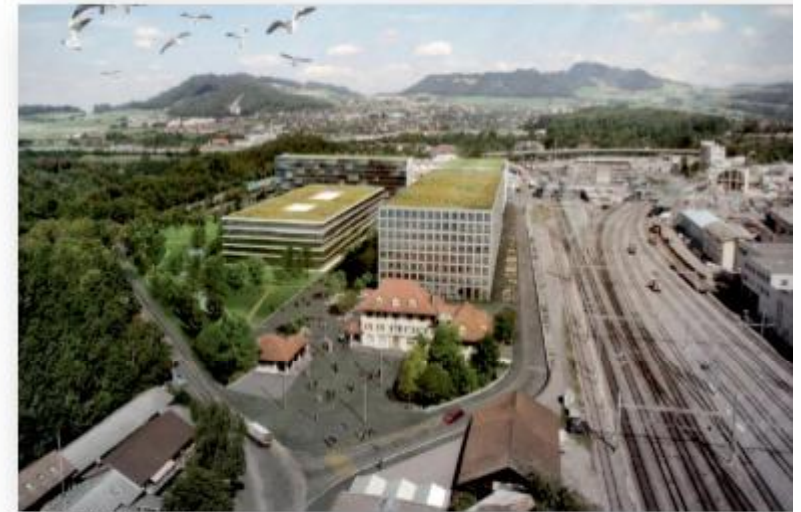
Bahnhof / Gebäude.