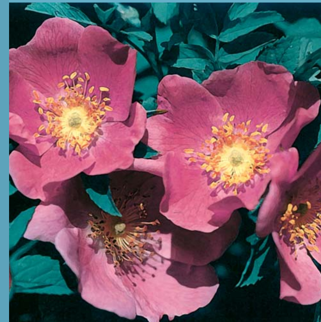
Wildrose: Zimtrose Rosa majalis

Augenweide und Gaumenfreude – im Mittelalter wurden Hagebutten der heimischen Wildrosen gerne zu Saft, Sirup, Essig und Mus verarbeitet. Heute ist bekannt, dass der hohe Vitamin C-Gehalt sie zu einer wertvollen Nahrungsergänzung machte. Aus ihren Wurzeln, Blättern, Blüten und Früchten wurden verschiedene Heilmittel hergestellt. Beliebt war dabei neben den heimischen Exemplaren auch die Essigrose ( Rosa gallica ). Sie stammt aus dem Nahen Osten und wurde in der Medizin unter anderem wegen ihrer blutstillenden Wirkung genutzt. Rosenblütenblätter dienten in der Burg- oder Klosterküche zum Würzen von Fleisch oder Süßspeisen. Vor dem Mahl wuschen sich die hohen Herrschaften die Hände in Schüsseln mit Rosenblüten. Da es in dieser Zeit noch wenige Zierpflanzen gab, pflanzte man die Wildrosen ausserdem gerne wegen ihrer schönen Blüten. Viele Wildrosenarten sind heute selten geworden, ein Beispiel dafür ist die heimische Zimtrose ( Rosa majalis ).