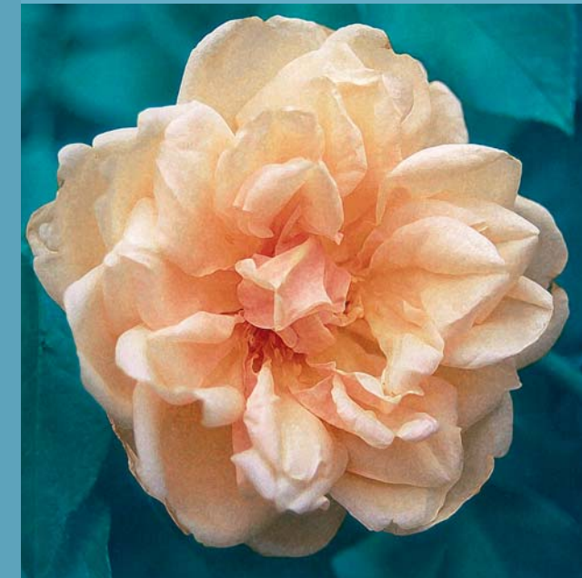
Kletterrose: 'Madame Bérard'

Quellen: Joyaux, François: Enzyklopädie der Alten Rosen, Stuttgart (Hohenheim) Ulmer, 2008; Markley, Robert: Die BLV-Rosen-Enzyklopädie, 5., neu bearbeitete und erweiterte Auflage, Neuausgabe, München: BLV Buchverlag; Fischer-Rizzi, Susanne: Blätter von Bäumen: Legenden, Mythen, Heilwunderungen und Betrachtung von einheimischen Bäumen, 7. Auflage, München: Hugendubel, 1994