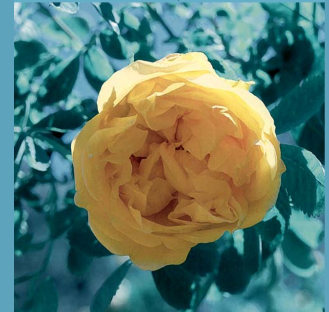
Alte Gartenrose: Rosa hemisphaerica

Viele Rosenliebhaberinnen und -liebhaber hegen und pflegen in ihren Gärten alte Rosen. Oft handelt es sich dabei einfach um alte Rosenstöcke, nicht aber um die in der Fachliteratur als «Alte Rosen» bezeichneten Sorten. Darunter versteht man Gartenrosen, die vor 1867 – dem «Geburtsjahr» der ersten Teehybride – kultiviert wurden. Die ältesten präzisen Informationen über Gartenrosen verdanken wir der Renaissance. Im 16. Jahrhundert entstanden Bücher mit wissenschaftlichen Darstellungen und die ersten botanischen Gärten. Im Mitteleuropa des 15. Jahrhunderts waren nur die von der Essigrose abstammenden Gallica-Rosen, die Albarose ( Rosa alba ), die Zentifolie ( Rosa centifolia ) und die Damaszenerrose ( Rosa x damascena ) bekannt. Die Damaszenerrose blühte übrigens als einzige zweimal im Sommer – wenngleich die Nachblüte nur sehr schwach war. Ab der Renaissance verbreiteten sich die Gartenrosen rasch. Ende des 18. Jahrhunderts existierten bereits Hunderte von Gallica-, Alba- und Zentifoliasorten.