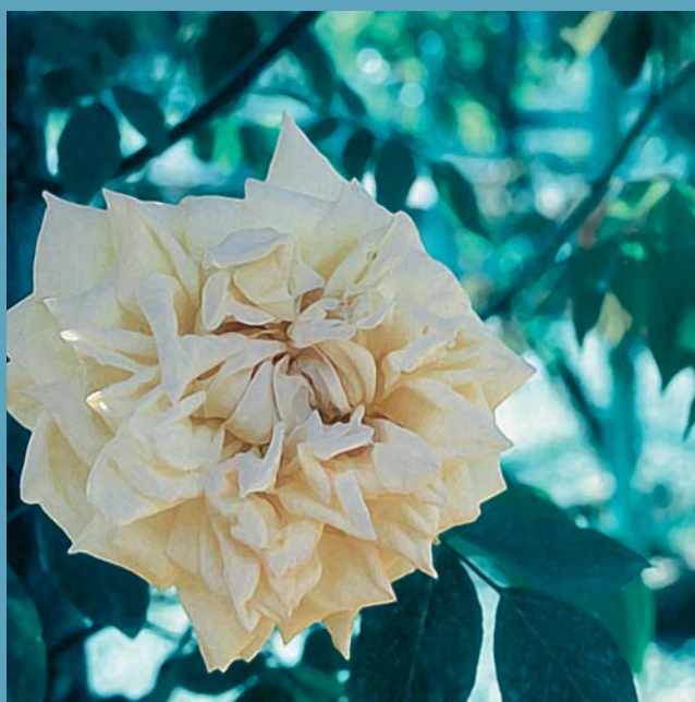
Chinarose: 'Park's Yellow Tea-scented China'