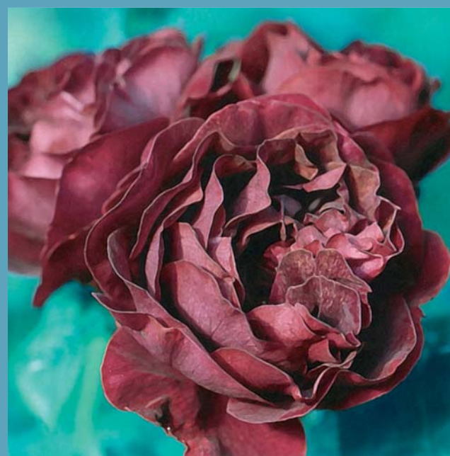
Remontant-Hybride: 'Souvenir du Docteur Jamain'

Die Kreuzungen der nach Tee duftenden Chinarosen mit verschiedenen Rosengruppen waren erfolgreich und führten in England zur neuen Gruppe der Teerosen. Diese entwickelte sich in einem unglaublichen Tempo: Um 1920 gab es bereits rund 1250 Sorten! Neben den