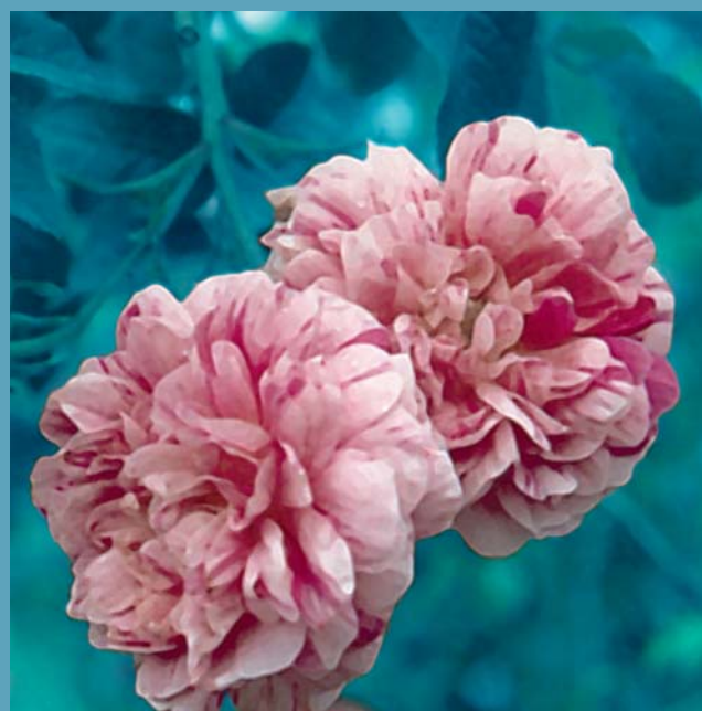
Romantica Rose: 'Belle des Jardins'

Im 19. Jahrhundert brach in Mitteleuropa eine wahre Rosenleidenschaft aus. Nicht nur Baumschulen, son-