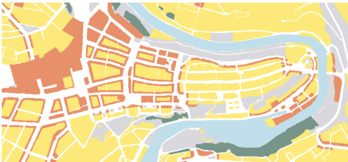
Orange: Lärmempfindlichkeitsstufe III / Gelb: Lärmempfindlichkeitsstufe II