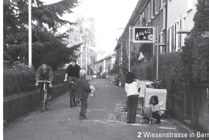
2 Wiesenstrasse in Bern