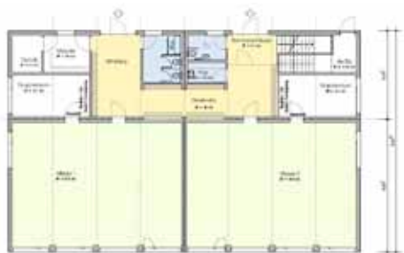
Grundrisse EG - 2. OG, Erne AG

Um den Bedarf der Volksschule Pestalozzi kurzfristig zu decken, wird ein Modulbau mit sechs Klasseneinheiten benötigt. Der dreistöckige Modulbau soll auf der Munzingerwiese neben der heutigen Aula (ehemals Turnhalle) errichtet werden. Die Parzelle ist als Nutzungszone «Freifläche B» und somit als Zone für öffentliche Nutzung bezeichnet. Planungsrechtlich ist ein Bau in der benötigten Grössenordnung grundsätzlich bewilligungsfähig. Das Areal ist erschlossen und die Terrainverhältnisse verlangen keine aufwändigen Grabarbeiten. Die Nähe zum Schulhaus Munzinger schafft räumliche Synergien mit dem bestehenden Schulbetrieb.