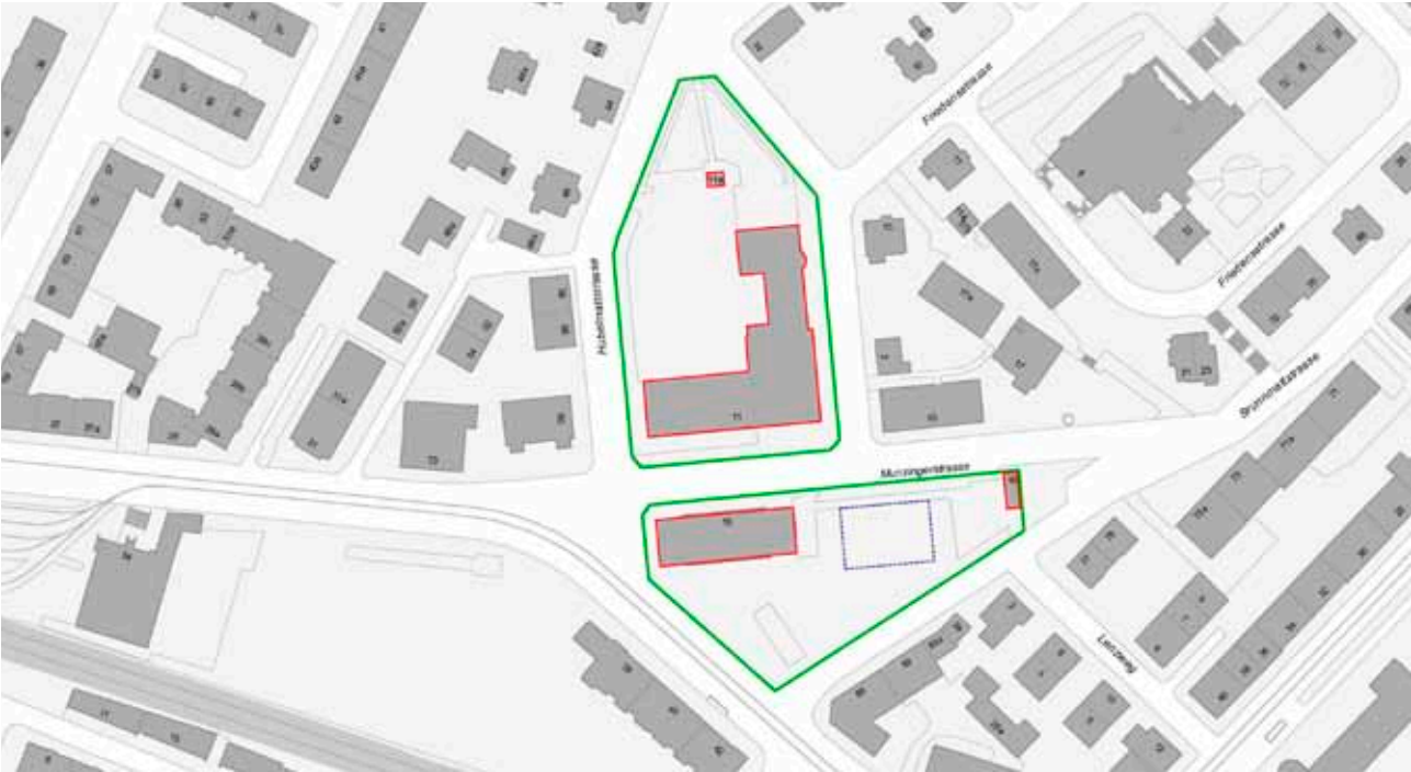
Zur Schule VS Munzinger gehörende Gebäude (rot) auf der Parzelle (grün), möglicher Standort Modulbau (blau)