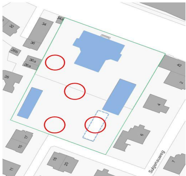
Mögliche Standorte für einen Neubau zur näheren Überprüfung

Es scheint naheliegend, den bestehenden Doppelkindergarten abzubauen und an seiner Stelle einen Neubau zu errichten. Bei näherer Betrachtung zeigt sich, dass sich auch andere Standorte auf dem Schulareal für einen Neubau eignen. Die Standortevaluation ist die erste zu klärende Frage, mit welcher sich die beauftragten Planer derzeit auseinandersetzen. Die Setzung des Neubaus muss mit der bestehenden Gebäudestruktur der Schulanlage übereinstimmen. Ebenso sind betriebliche Abläufe, pädagogische Anforderungen sowie die Aussenraumnutzung zu berücksichtigen. Eine enge Zusammenarbeit mit Schulamt, Bauinspektorat, Immobilien Stadt Bern, Stadtplanungsamt und der Denkmalpflege ist unabdingbar.