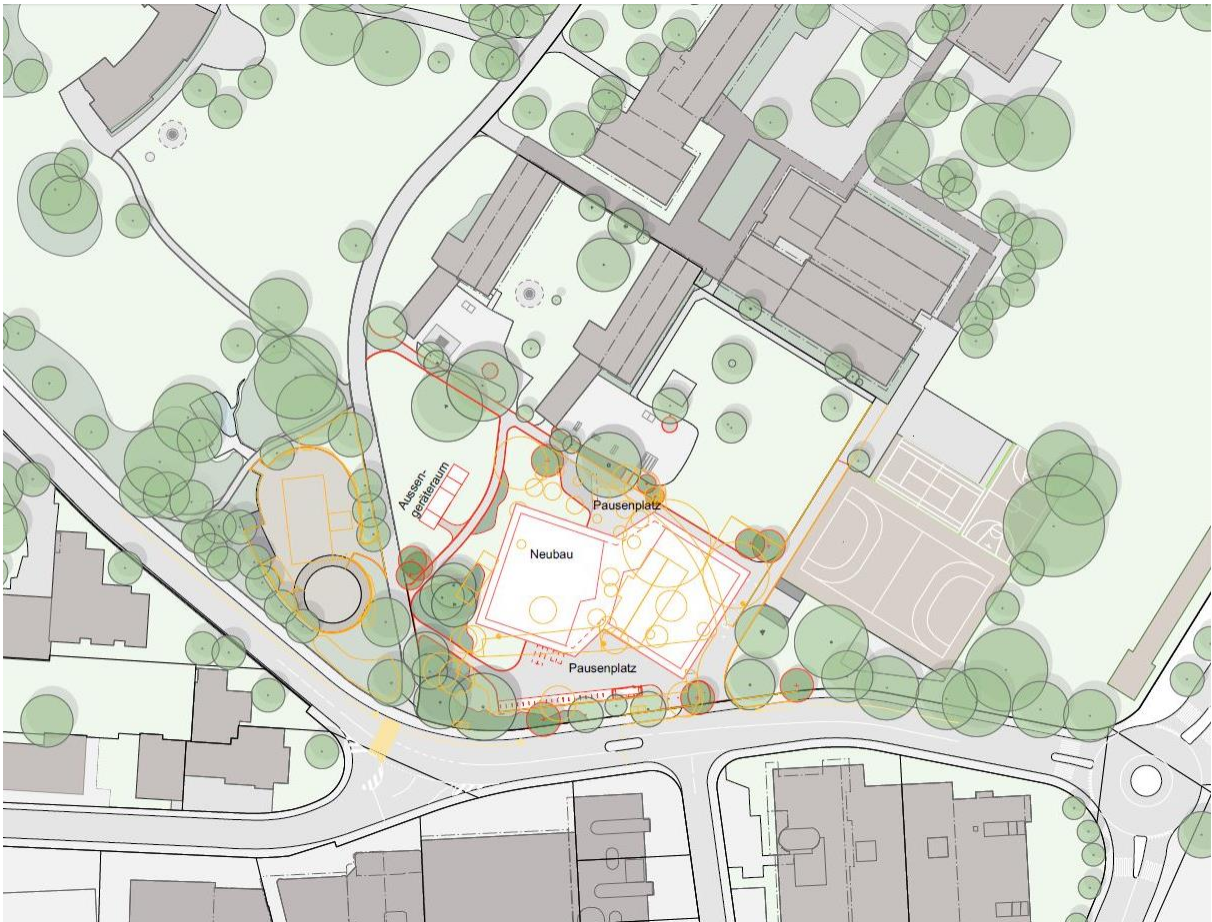
Situation Neubau VS Marzili