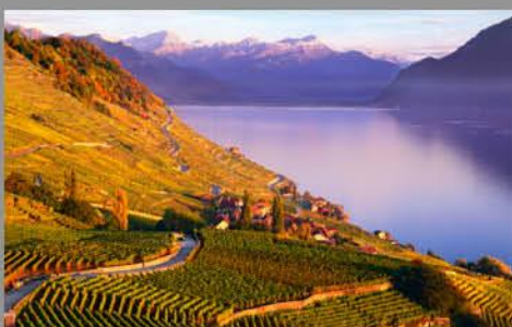
Lavaux, Weinberg-Terrassen Lavaux, vignoble en terrasses www.lavaux-unesco.ch