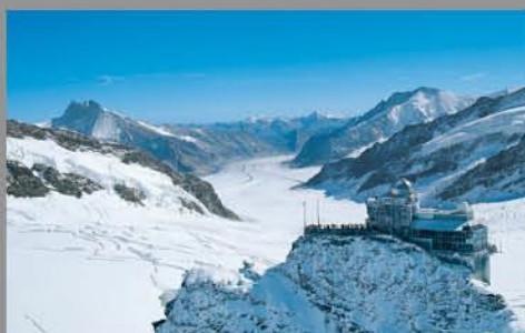
Swiss Alps Jungfrau-Aletsch Swiss Alps Jungfrau-Aletsch www.jungfrau-aletsch.ch