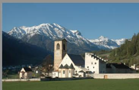
Kloster St. Johann in Müstair Couvent Saint-Jean à Müstair www.muestair.ch