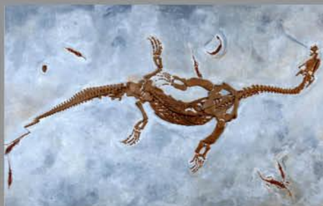
Monte San Giorgio Monte San Giorgio www.mendrisiottoturismo.ch