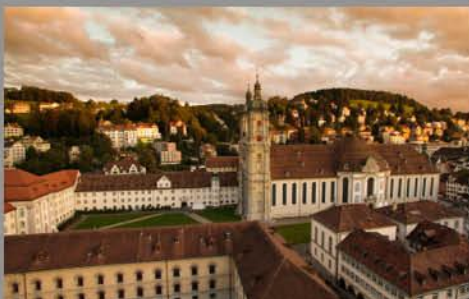
Stiftsbezirk St. Gallen Domaine conventuel de Saint-Gall www.st.gallen-bodensee.ch