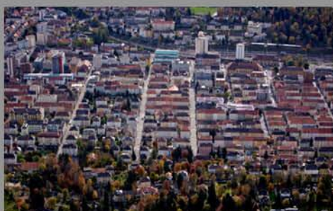
La Chaux-de-Fonds / Le Locle La Chaux-de-Fonds / Le Locle www.watch-cities.ch