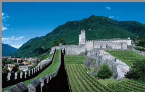
Drei Burgen von Bellinzona Trois châteaux de Bellinzone www.bellinzone-altoticino.ch