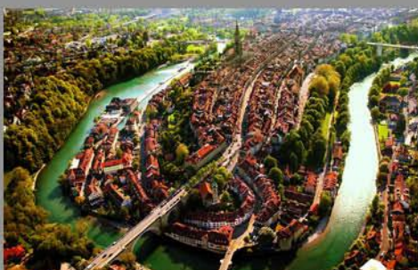
Altstadt von Bern Vieille ville de Berne www.bern.com

Biens du Patrimoine mondial de l'UNESCO en Suisse