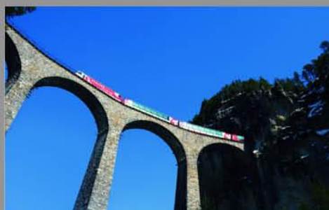
Rhätische Bahn, Albula / Bernina Chemin de fer rhétique, Albula / Bernina www.rhb.ch/unesco