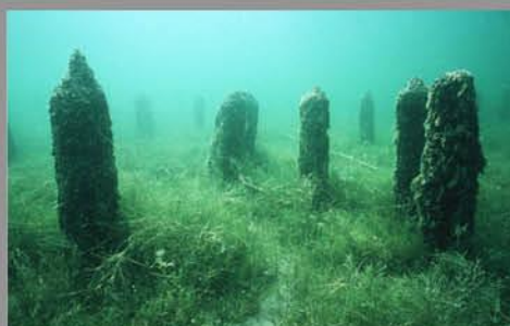
Prähistorische Pfahlbauten Sites palafittiques préhistoriques www.palafittes.org

WELTERBETAGE JOURNEES DU PATRIMOINE MONDIAL GIORNATE DEL PATRIMONIO MONDIALE 11. – 12.06.2016