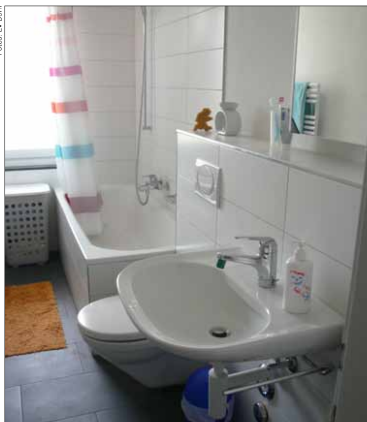
Zeitgemässes Badezimmer: Hier machen Baden und Duschen Spass.

An dieser Stelle bedanken wir uns bei unseren Mieterinnen und Mietern der Wylerfeldstrasse 8 für ihre Flexibilität und Toleranz während der ganzen Bauzeit. ■