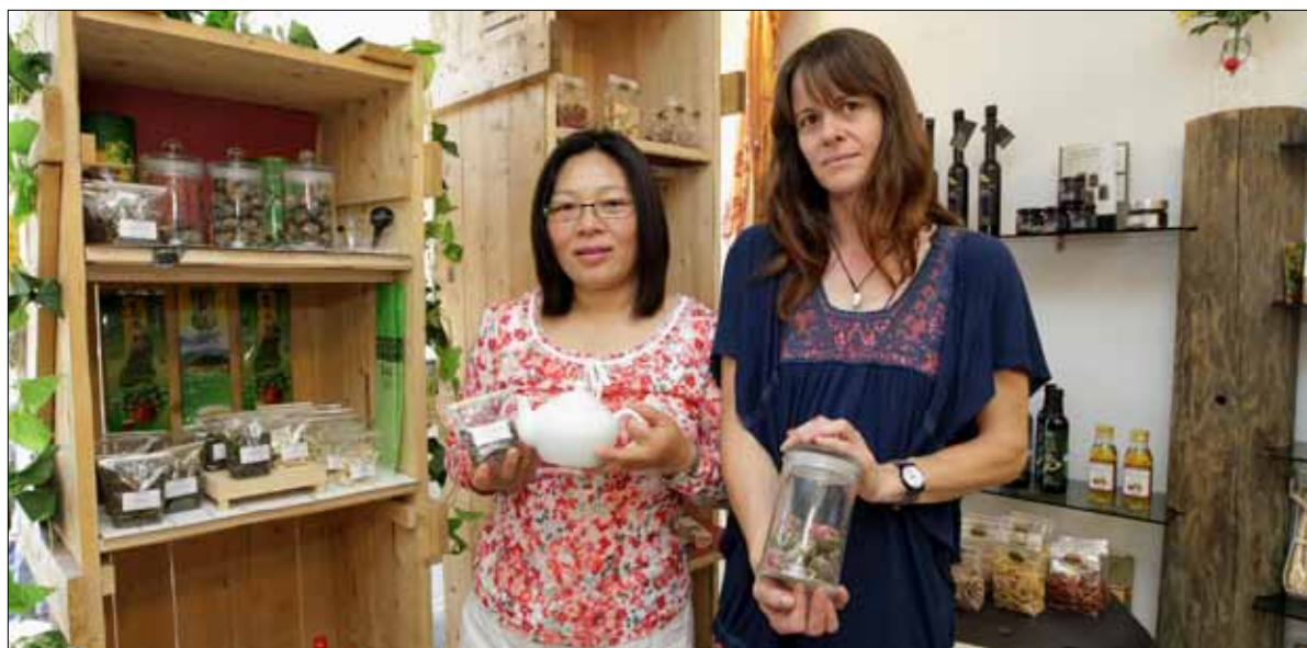
Qual der Wahl: Im Lido-Laden gibt's nicht nur Lebensmittel zu kaufen.