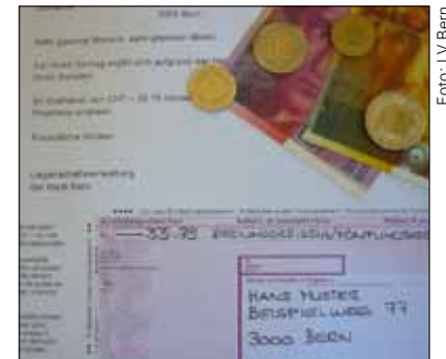
ASR: Auszahlung verursacht hohe Gebühren

In den kommenden Monaten werden wir alle Mieterinnen und Mieter anschreiben und sie bitten, uns ihre Kontoverbindung mitzuteilen. Sollte die nächste Heiz- und Nebenkostenabrechnung ein Guthaben ausweisen, können wir dank diesen Kontoangaben eine rasche Auszahlung sicherstellen