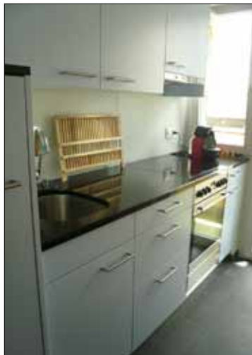
Nachher: Moderne Küchenkombination.