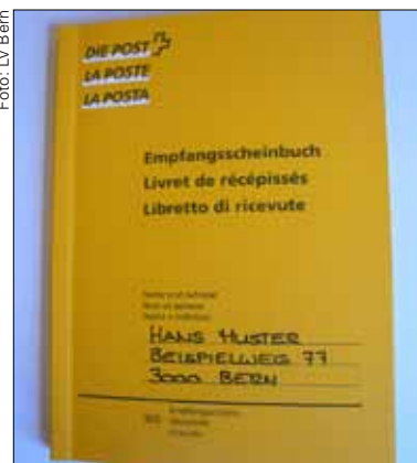
Barzahlung am Postschalter ist nicht mehr zeitgemäss

Die Differenz erhält die Post als Entschädigung für das Entgegennehmen Ihrer Einzahlung und die Weiterleitung des Betrags an die Liegenschaftsverwaltung der Stadt Bern. Letztes Jahr hat die Post aufgrund von Bareinzahlungen unserer Mieter rund CHF 34'000.– an Gebühren eingenommen. Dieser stattliche Betrag fehlt bei unseren Mieteinnahmen.