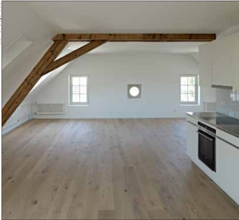
Einzigartiges Raumgefühl im ausgebauten Dachgeschoss.

6-Zimmer-Wohnungen. Der Zusammenschluss der Wohnungen erfolgte durch einen Durchbruch zwischen den beiden Hauptwohnräumen. Zwei Fenster wurden zu Fenstertüren ausgebrochen, die nun einen attraktiven direkten Zugang zum Garten ermöglichen. Diese privaten Aussenräume mit den schattenspendenden Glyzinen auf der Pergola werden von den neuen Mietern der Wohnungen im Erdgeschoss sehr geschätzt und erhöhen die Wohnqualität in der warmen Jahreszeit erheblich.