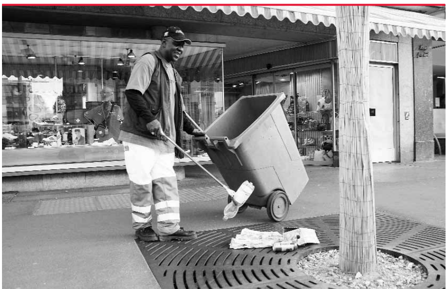
Das Wegräumen von illegal entsorgtem Abfall kostet zehnmal mehr als dasjenige von korrekt entsorgtem Kehricht: Mitarbeiter des Tiefbauamts auf der Abendreinigungstour.

Grundsätzlich kämpft Bern mit den gleichen Problemen wie andere Städte: Auch anderswo nimmt das Littering (achtloses Wegwerfen oder Liegenlassen von Abfall) zu, auch anderswo steigen Alkoholkonsum im Freien und Vandalismus im öffentlichen Raum. Die vielen Zentrumsfunktionen Berns verschärfen jedoch