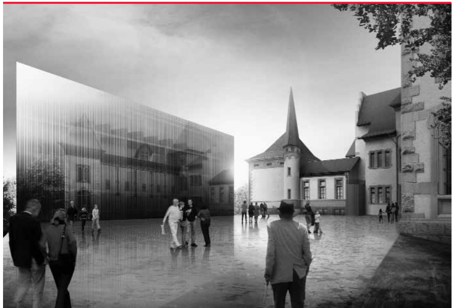
Ab Frühling 2009 der neue Standort des Stadtarchivs: der Kubus, welcher unmittelbar neben dem Historischen Museum Bern zu stehen kommt.

Ein Umzug dieses Ausmasses erfordert eine ausgeklügelte Logistik. Diese hat sich das Stadtarchiv im Vorfeld erarbeitet. Es erkundigte sich bei anderen Archiven mit Umzugserfahrung und skizzierte aufgrund der Erkenntnisse einen genauen Ablaufplan. «Die Bestände sollen in einer möglichst konzentrierten Aktion und in möglichst kurzer Zeit gezügelt werden», verrät Emil Erne. «Wir ziehen daher erst ein, wenn das Gebäude fertig gestellt ist.» Ein kompakter Umzug hat viele Vorteile, nicht zuletzt den eines minimalen Betriebsunterbruchs. «Entscheidend ist für uns, dass die Archivräume nach dem Bau ein gutes Klima aufweisen», führt der Stadtarchivar weiter aus. Das bedeutet in erster Linie, dass sie genügend ausgetrocknet sind. Um das Raum-