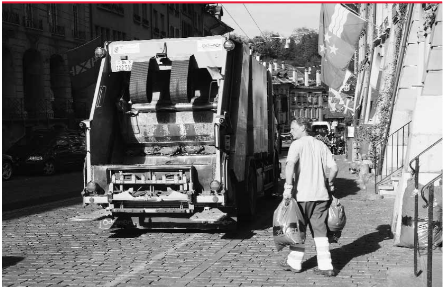
In der Stadt Bern fallen pro Jahr weit über 60'000 Tonnen Abfall an: Mitarbeiter der Entsorgung auf der bewährten Samstagtour in der Unteren Altstadt.

Weitere 90 Personen arbeiten bei der Abfallentsorgung. Sie sammeln und entsorgen Jahr für Jahr weit mehr als 60'000 Tonnen Abfall. Tendenz steigend. Zwei Mitarbeiter sind täglich unterwegs, um unkorrekt bereitgestellte Abfälle einzusammeln und deren Verursacher zu ermitteln. Drei weitere befreien die rund 50 Sammelstellen von Abfällen und ent-