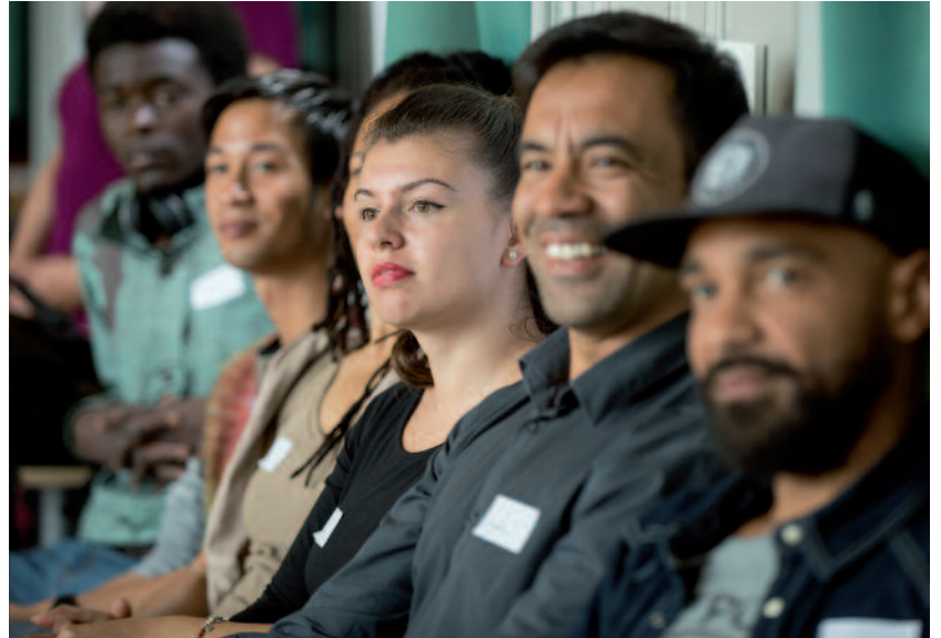
Eine vielfältige Bevölkerung braucht eine vielfältige Verwaltung: KI-Mitarbeitende und Gäste an der Verleihung des Integrationspreises.

Im neuen Gesetz ist explizit festgehalten, dass niemand diskriminiert werden darf. Dies gilt auch für den Zugang zu den kommunalen Dienstleistungen. «Die Stadt Bern muss Diskriminierung in diesem Bereich aktiv