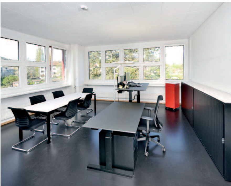
Standardisierte Tische, Stühle und Rollschränke: So sieht das neue «Büro Stadt Bern» aus.