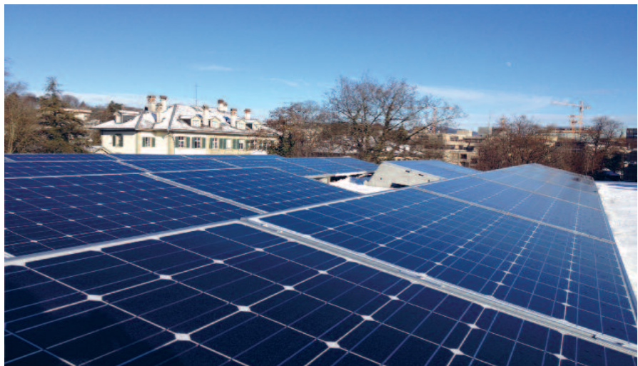
Erneuerbare Energie: Solarstromanlage auf der Gewerblich-Industriellen Berufsschule Bern (GIBB).

Schritt die Energie- und Klimastrategie 2025. Sie bricht die Vorgaben des Richtplans auf zehn Jahre herunter und konkretisiert Massnahmen sowie Handlungsfelder. Elf Leitsätze (siehe Kasten) umreissen die energiepolitische Vision der Stadt Bern und bilden die Leitplanken für die Umsetzung. Sie sind abgestimmt auf die strategischen Grundlagen von Bund und Kanton. Aufgrund der Leitsätze und der Grobziele des Richtplans legte die