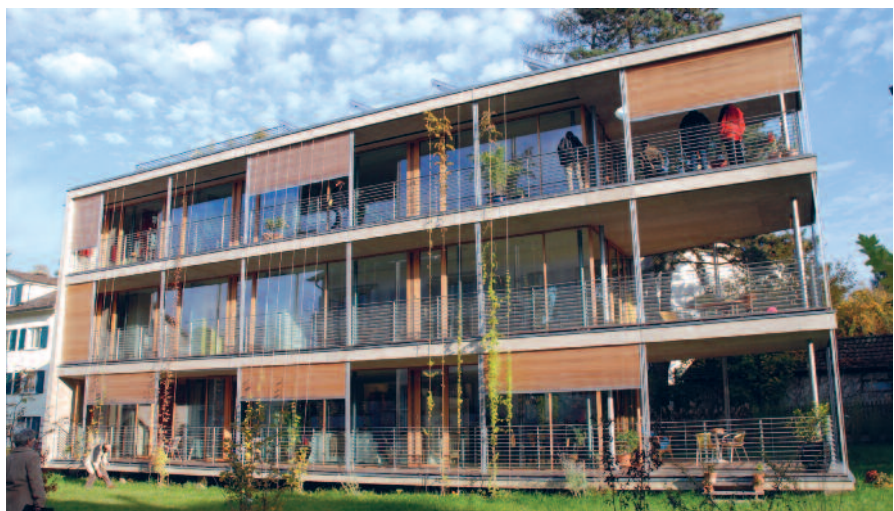
Energieeffizientes Bauen: Das erste MINERGIE-P-ECO-zertifizierte Gebäude der Schweiz in Bern-Liebefeld.