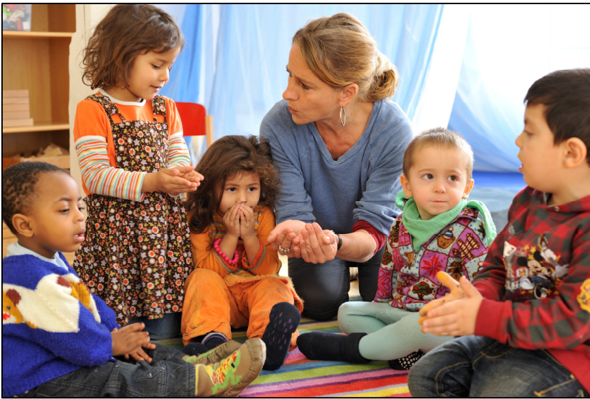
Bildlegende: Im Kinderhaus Bümpliz