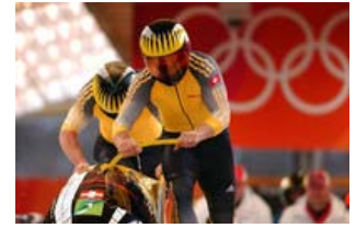
Teamwork ist gefragt - um die komplexe Herausforderung der Kombination von Berufslehre und Sport zu bestehen.