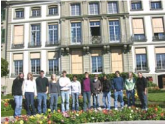
In fünfzehn Dienststellen werden zwei Berufe mit insgesamt 18 Lernende angeboten.

Die Aufgaben in der Präsidialdirektion sind wie folgt gegliedert: