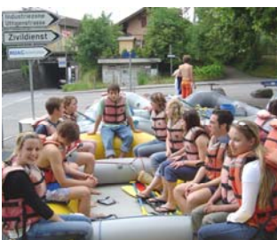
Aus-, Ab-, Überfliegen: Berufsbildung ausserhalb des Büroalltags.

Als zentrales Führungsinstrument werden durch den Direktionsberufsbildner während der gesamten Lehre Fördergespräche durchgeführt. Themen: Schule, Betrieb, Fördermassnahmen, Laufbahn.