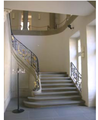
Die Lernenden sind Bestandteil der Unternehmenskultur und leisten einen wertvollen Beitrag zum Arbeitsergebnis.