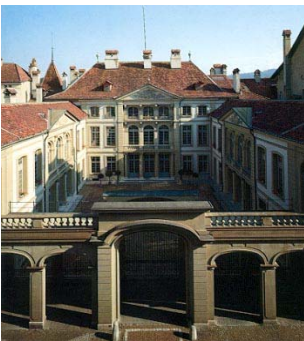
Die Aufgaben in der Berufsbildung sind im Berufsbildungskonzept klar definiert. Die Ausbildungsverantwortlichen sorgen gemeinsam für eine jugend- und laufbahngerechte Ausbildung.