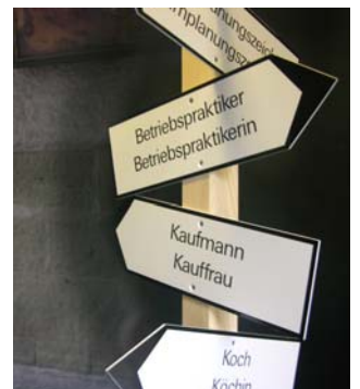
Ausbilderinnen und Ausbilder nehmen in der Berufsbildung eine zentrale Rolle ein.