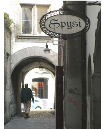
Berufsbildung auch sozial engagiert: Servier-Einsatz in der Speiseanstalt der unteren Berner Altstadt „Spysi“.

Lernende nehmen nur an Veranstaltungen / Ausflügen der aktuellen Ausbildungsdienststelle teil.