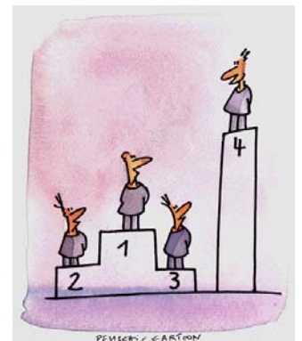
Während je zwei Monaten werden in sechs Ausbildungs- und Lernsituationen (ALS) die konkreten Leistungen im Arbeitsalltag beurteilt.