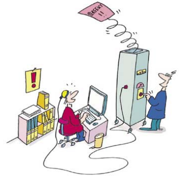
In drei Prozesseinheiten (PE) werden komplexe Arbeitsprozesse von den Lernenden dokumentiert, analysiert und beurteilt.