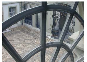
Aus- und Einblicke: TimeOut und TimeOut Plus als Mitwirkungsinstrumente für die Lernenden.