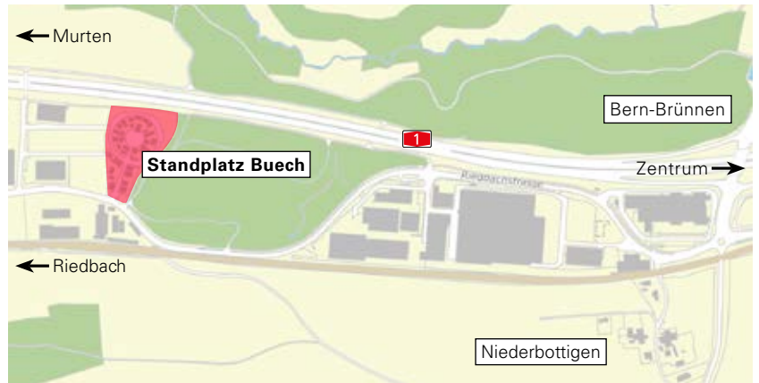
Die Lage des Platzes.