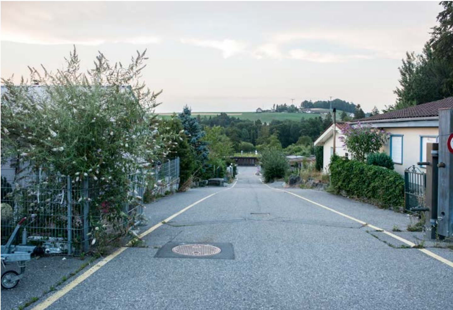
Sicht von der Einfahrt zum Mittelpunkt des Standplatzes.

Über ein halbes Jahrtausend lang wurden Jenische, Sinti und Roma in der Schweiz stigmatisiert, verfolgt, vertrieben – und noch bis in die 1970er-Jahre zwangsassimiliert. Die Stadt Bern bildete da keine Ausnahme. Doch Akten zeigen, dass die Stadtberner Regierung mindestens seit der Mitte des 20. Jahrhunderts versuchte, Lebensraum für die mit Bern verbundenen Fahrenden zu schaffen. 1 Gleichwohl lebten letztere auch Anfang der 1990er-Jahre immer noch in einem Provisorium, das wohnhygienische Standards nicht erfüllte.