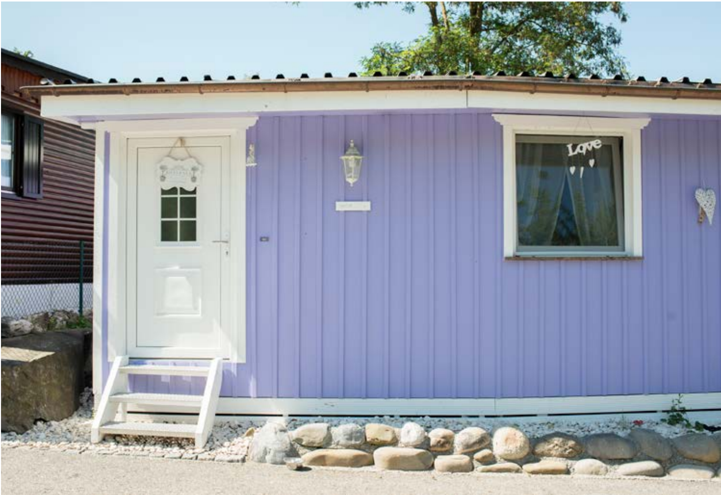
Wohnlichkeit 20 Jahre nach der Eröffnung: Ein Haus im Buech im Sommer 2018.