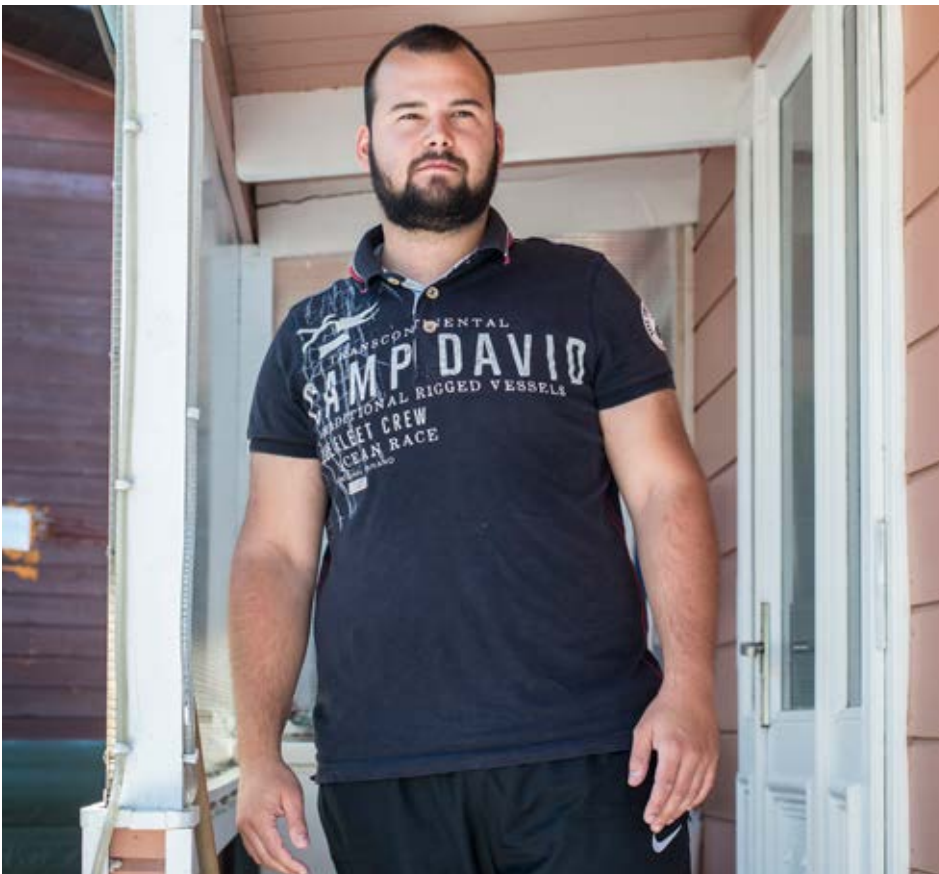
Zu Besuch bei den Eltern auf dem Standplatz Buech.

Stand- und Durchgangsplätze sind landesweit Mangelware; die Schaffung neuer Plätze ist Aufgabe der Kantone. Landesweit fehlen gemäss Standbericht der Stiftung Zukunft für Schweizer Fahrende rund 25 Standplätze und gar 50 Durchgangsplätze. Auch im Buech wird der Platz eng. Eine vom Gemeinderat in Auftrag gegebene Analyse kam zum Schluss, dass auf dem Standplatz Buech innerhalb der nächsten fünf Jahre ein Bedarf nach rund 15 zusätzlichen Stellplätzen für die heranwachsende Generation besteht. Der Maximalbedarf gemäss Angaben der Bewohnenden des Standplatzes liegt sogar bei 20 zusätzlichen Plätzen. Der Berner Gemeinderat sieht den Kanton Bern in der Pflicht, weitere Stand- und Durchgangsplätze zu schaffen. Im Kanton Bern existieren neben jenem im Buech zwar auch in Biel (15 Stellplätze) und in Belp (3 Stellplätze) weitere Winterplätze. Gleichwohl befinden sich zwei Drittel aller bernischen Winterstellplätze auf Stadtberner Boden. Seit fünf Jahren betreibt die Stadt Bern an der Wölflistrasse zudem einen provisorischen Durchgangsplatz. Er ist kantonsweit einer der grössten.