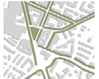
Stützpunkt, Scharung und Wirkung der Raumstruktur