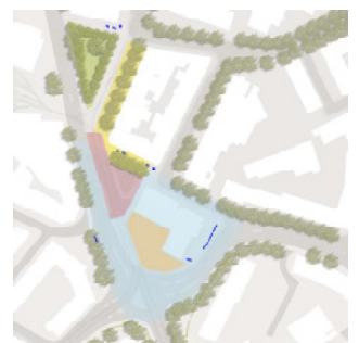
Wirkung des öffentlichen Raums