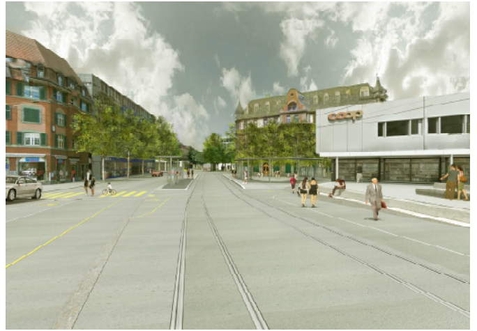
Blick entlang Eigerstrasse stadteinwärts