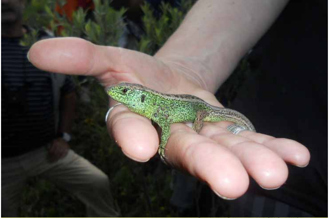
Zauneidechse, Rehhaggrube, 2012