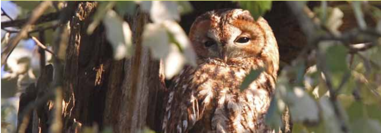
Waldkauz, Eifenau, 2010

Gestützt auf einen Auftrag des Gemeinderates, hat die Stadtgärtnerei Bern seit 2008 diverse Massnahmen zur Förderung der Biodiversität umgesetzt. Es hat sich aber gezeigt, dass vereinzelte und punktuelle Massnahmen nicht ausreichen, um den heute beobachteten Rückgang der Biodiversität zu stoppen. Mit der im vorangehenden Abschnitt erwähnten stadträtlichen Motion sind ausserdem neue Stossrichtungen vorgegeben worden, die es weiter zu verfolgen gilt.