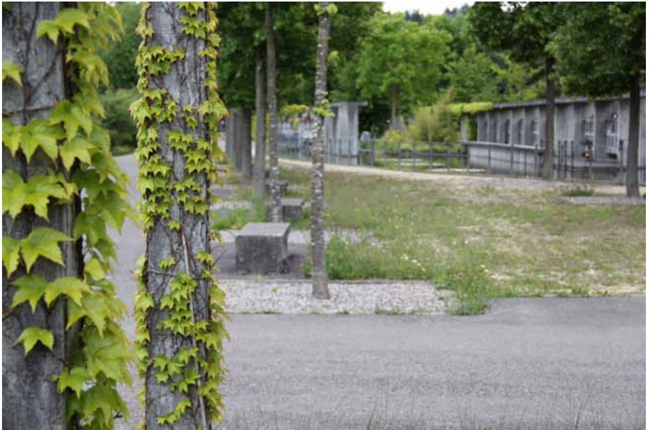
Neuer Teil Friedhof Bümpliz, 2011