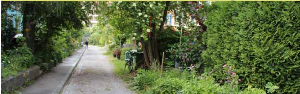
Konradweg, Länggasse, 2011

Um die Biodiversität in der Stadt Bern mittel- und langfristig zu erhalten, reichen isolierte Massnahmen zugunsten einzelner ökologisch wertvoller Gebiete, Lebensräume oder Arten nicht aus. Die Stadt muss gesamthaft gewisse Grundvoraussetzungen erfüllen, damit die Lebensräume und Arten in ihr bestehen und gedeihen können.