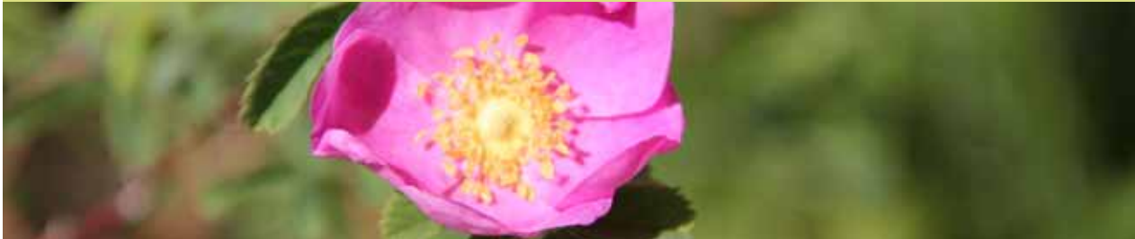
Zimtrose, Rosengarten, 2011

Biodiversität bezieht sich auf die gesamte Vielfalt der belebten Welt. Doch dürfte die Vielfalt der Arten (Pflanzen, Tiere, Pilze, Mikroorganismen) jene Ebene der Biodiversität sein, die den Menschen am vertrautesten ist. Die Vielfalt von Tier- und Pflanzenarten in der Stadt Bern ist bemerkenswert hoch. Allerdings kommen gerade seltene Arten heute oft nur noch vereinzelt vor. Aufgrund mangelnder Lebensräume und ungenügender Vernetzung sind sie gefährdet.