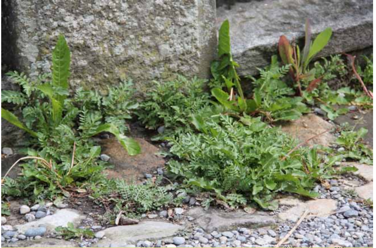
Wyderain, Länggasse, 2011