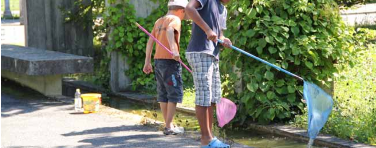
Friedhof Bümpliz, 2011

Die städtischen Behörden und die grösseren institutionellen oder privaten Akteure, beispielsweise Bauherrschaften, Bauunternehmungen oder Liegenschaftsverwaltungen, spielen eine wichtige Rolle bei der Förderung der Biodiversität in der Stadt Bern. Nicht zu unterschätzen ist aber auch der Anteil, den die einzelnen Bürgerinnen und Bürger haben. Für alle gilt: ein breites und fachlich differenziertes Naturwissen ist ein Erfolgsfaktor, wenn es darum geht, die Biodiversität langfristig zu erhalten und zu fördern.