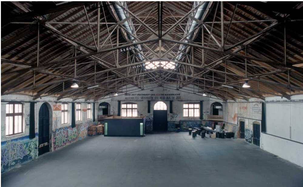
Innenraum Grosse Halle mit Blick zum Haupteingang (Foto Thomas Keller, 2003)

Das Programm der Grossen Halle besteht aus Veranstaltungen verschiedenster kultureller Akteure und Sparten wie zum Beispiel spezielle Opern von Konzert Theater Bern KTB, Partys, das kooperative, auf Freiwilligenarbeit basierende UNA-Festival oder die Eigenveranstaltungen Blinde Insel sowie der Flohmarkt.