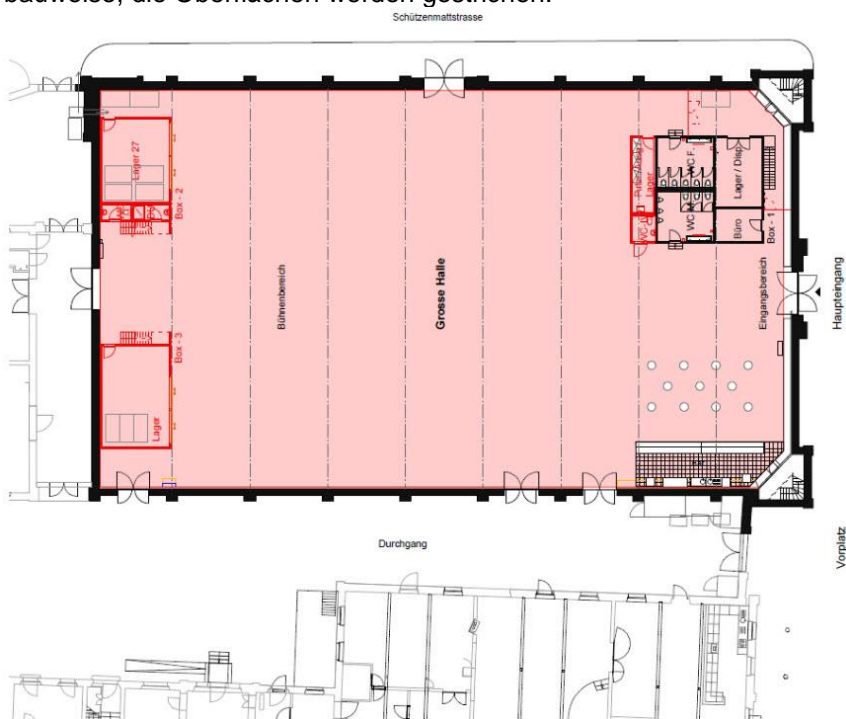
Grundriss Grosse Halle, bauliche Massnahmen in rot

In der Studie des Vereins Trägerschaft Grosse Halle von 2013 war vorgesehen, die drei eingebauten Infrastrukturboxen durch grössere zu ersetzen. Da jedoch nur eine zusätzliche relativ dünne Schicht Bodenbelag aufgebracht werden soll, ist eine Demontage aller Einbauten nicht mehr zwingend notwendig und noch Brauchbares kann damit weiterverwendet werden. So bleibt die Box beim Eingang erhalten und wird um eine Raumschicht für die Unterbringung einer hindernisfrei zugänglichen Toilette und eines notwendigen Putzraumes erweitert. Ersetzt werden lediglich die beiden Boxen im hinteren Teil der Grossen Halle. Diese fallen etwas grösser aus als die bestehenden beiden Boxen vor der Rückwand, sind doppelstöckig und bieten Platz für drei Künstlergarderoben, WC, Dusche und einen Lagerraum. Die Erstellung der schlichten Baukuben erfolgt in Holzbauweise, die Oberflächen werden gestrichen.