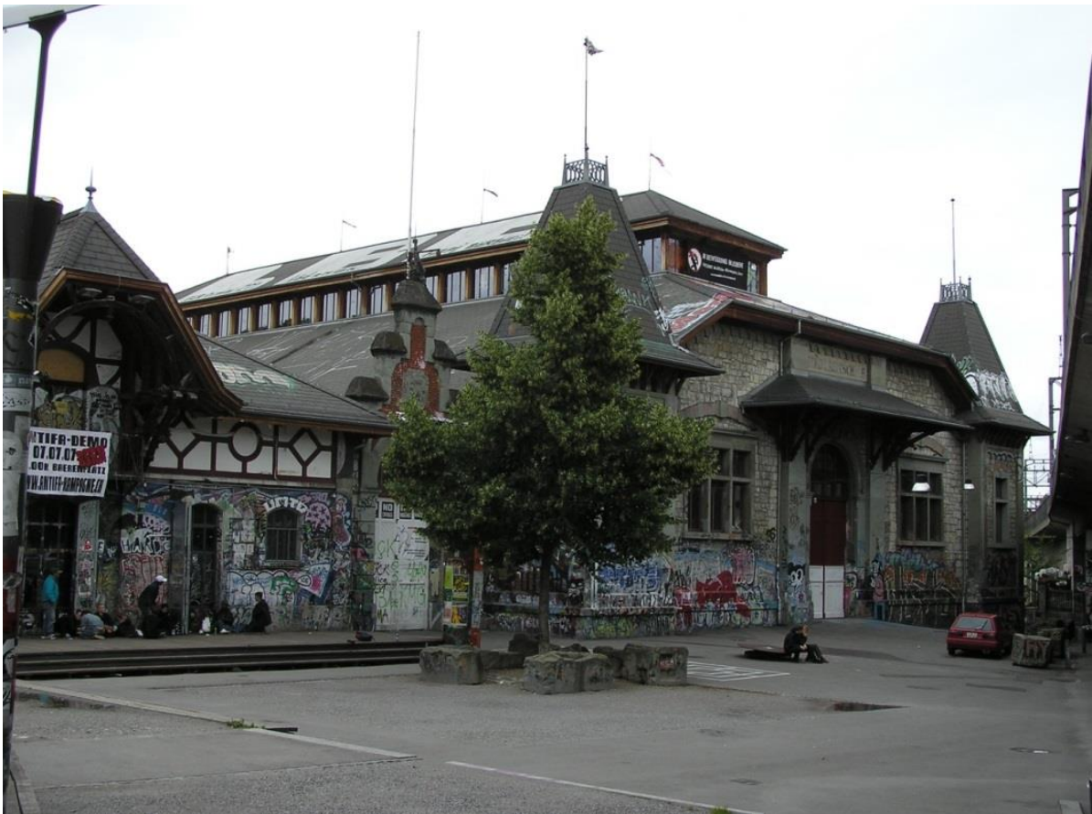
Reitschule; Vorplatz und Grosse Halle

Nach Aussagen der Nutzerschaft bestehen teilweise Funktionsbeeinträchtigungen und Geruchsbelästigungen durch das Kanalisationsnetz. Eine umfassende Untersuchung hat gravierende Mängel in der Grundstückentwässerung ergeben. Der Hauptstrang durch den Hof, etliche Anschlussleitungen und Dachwasserleitungen erfordern eine Sanierung mittels Schlauchrelining. Dies ist ein übliches Verfahren zum Aufbringen einer neuen dichten inneren Kunststoffschicht im bestehenden Abflussrohr. Für die Küche des Restaurants „Sous Le Pont“ muss den gesetzlichen Vorgaben entsprechend ein Öl-/Fettabscheider eingebaut werden. Einige Anschlussleitungen aus der Zeit der letzten Sanierung der Reitschule im Jahr 2004 benötigen keine neuen Massnahmen. Durch das vorgesehene Baubewilligungsverfahren ist die behördliche Auflage zum Nachweis einer intakten Gebäudekanalisation zu erwarten.