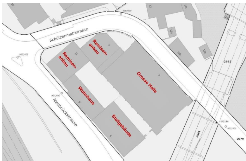
Gebäude der Anlage Reitschule

Die städtische Reitschule wurde 1895 bis 1897 durch den Berner Architekten Albert Gerster erbaut. Die gesamte Anlage ist denkmalpflegerisch geschützt.