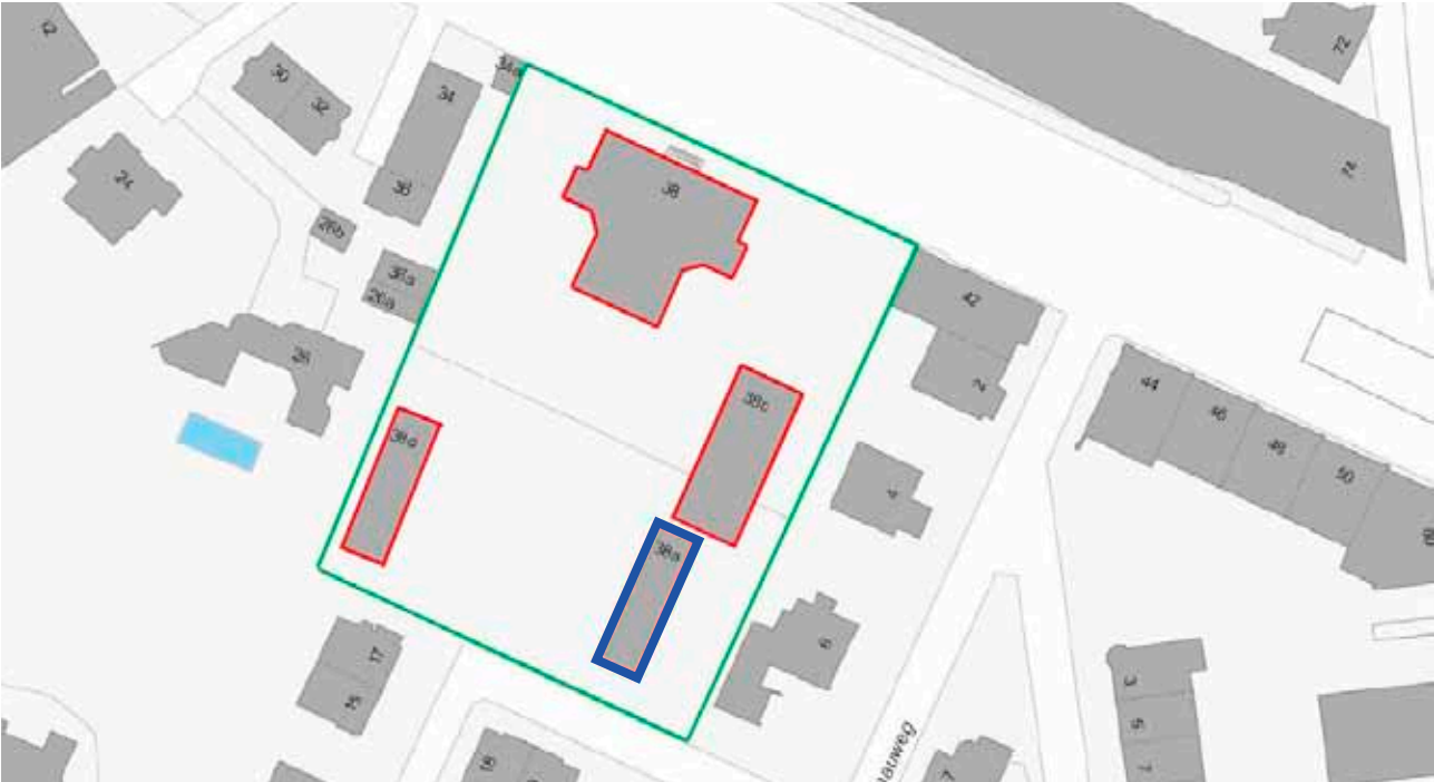
Zur Schule VS Sulgenbach gehörende Gebäude (rot) auf der Parzelle (grün), mit bestehendem Kindergartengebäude 38a (blau)