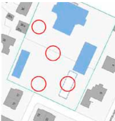
Mögliche Standorte für einen Neubau zur näheren Überprüfung

Der bald 70-jährige bestehende Kindergarten entspricht den Anforderungen für eine Basisstufe in betrieblicher, räumlicher wie auch pädagogischer Sicht nicht mehr. Im Weiteren ist der Gebäudezustand sanierungsbedürftig. Es scheint naheliegend, den bestehenden Doppelkindergarten abzubauen und an seiner Stelle einen Neubau zu errichten. Bei näherer Betrachtung zeigt sich, dass auch andere Standorte auf dem Schulareal für einen Neubau eignen. Die Standortevaluation ist die erste zu klärende Frage, mit welcher sich die beauftragten Planer derzeit auseinander setzen. Die Setzung des Neubaus muss mit der bestehenden Gebäudestruktur der Schulanlage übereinstimmen. Ebenso sind betriebliche Abläufe, pädagogische Anforderungen sowie die Aussenraumnutzung zu berücksichtigen. Eine enge Zusammenarbeit mit Schulamt, Bauinspektorat, Stadtplanungsamt und der Denkmalpflege ist unabdingbar. Um das neue Volumen zu optimieren, sollen Synergien zwischen den vorhandenen und den nach dem Richtraumprogramm für Schulen erforderlichen Räume definiert werden. Je nach Projekt können Räume wie: Windfang/Garderobe, WC-Anlagen, Technik-, Putz- und Materialraum sowie die notwendigen Aussenspielflächen gemeinsam genutzt werden oder in ihrem Flächenanspruch reduziert werden. Der Neubau wird gemäss den Vorgaben des Gemeinderates im Standard Minergie P-ECO geplant.