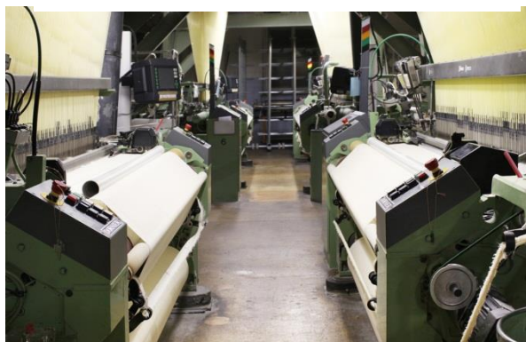
Abbildung 5: Burgdorf, Jacquard-Webmaschinen der Schwob AG