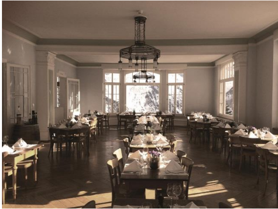
Abbildung 7: Mürren, Speisesaal Hotel Regina