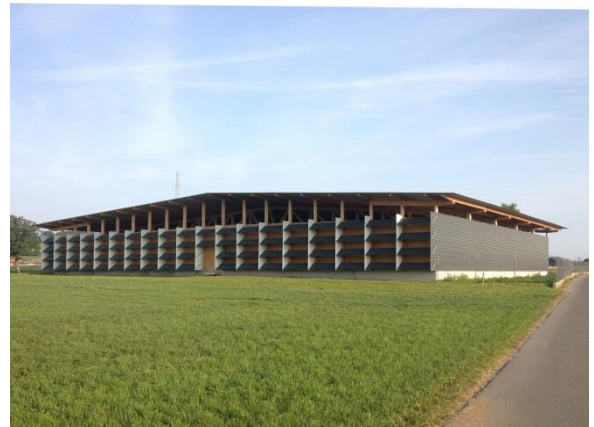
Abbildung 8: Schwarzenburg, Ehem. Kurzwellen- sender Schwarzenburg ca. 1975 und 2014