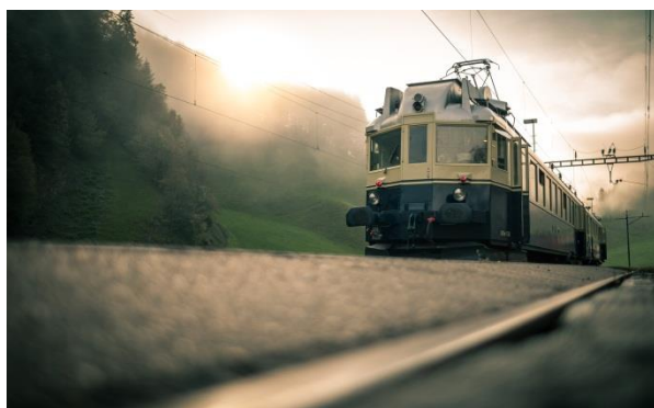
Abbildung 4: Burgdorf, Der «Blaue Pfeil»