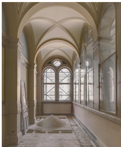
Abbildung 1: Bern, Bundeshaus Ost