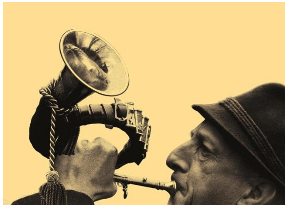
Abbildung 9: Utzenstorf, Schloss Landshut, Jäger mit Jagdhorn

Die Bilder stehen ab 07.09.2015, 9.00 Uhr im Internet zur Verfügung: www.be.ch/medienmitteilungen