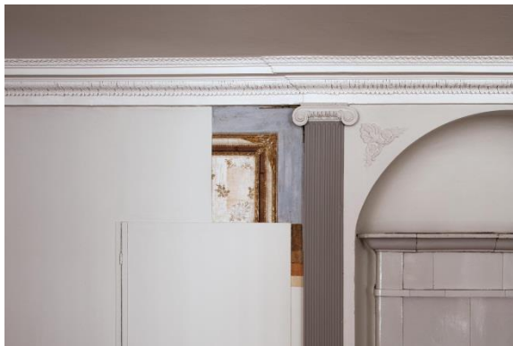
Abbildung 2: Bern, Büro Münsterstrasse 32