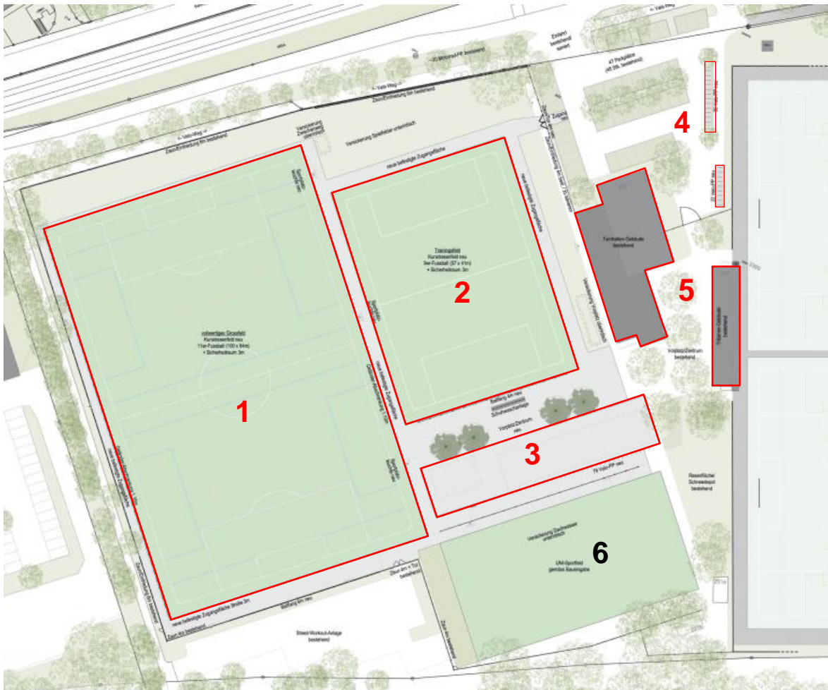
Situation Projekt Minimalsanierung und Neubau Kunstrasenspielfelder, bauliche Eingriffe rot markiert: Zwei neue Kunstrasenspielfelder (Grossfeld (1) und Kleinfeld (2)), neues temporäres Garderobengebäude (3) (Container) mit Photovoltaikanlage, Velo-Unterstände (4), Minimalsanierung bestehende Turnhallen- und Tribünengebäude (5), einfaches Trainingsfeld (6)