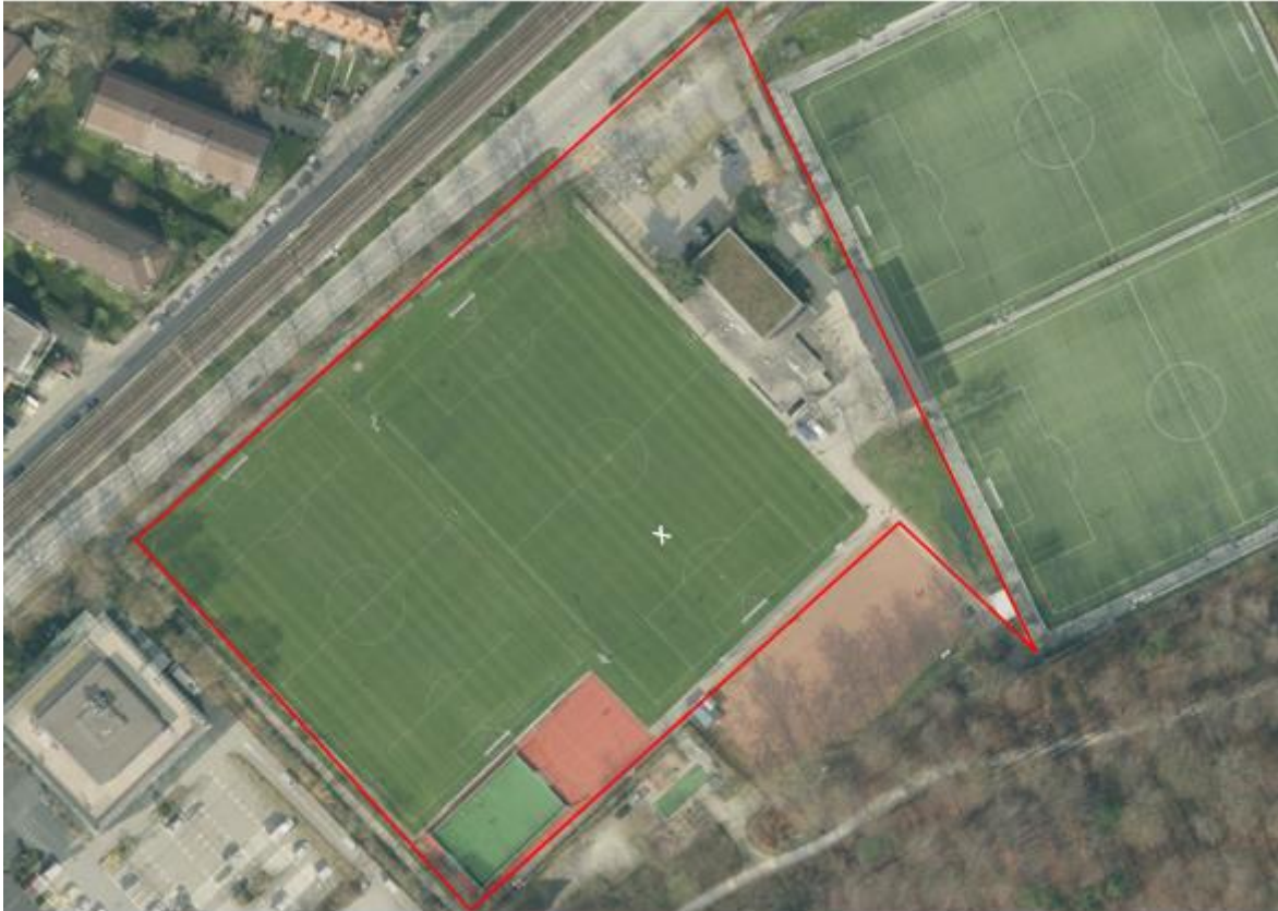
Heutige Sportanlage Bodenweid: Rot dargestellt der Perimeter des vorliegenden Projekts «Minimalsanierung und Neubau Kunstrasenfelder für 10 bis 15 Jahre». Rechts sind die im 2009/2010 realisierten zwei Fussball-Kunstrasenfelder zu sehen.

Der Gemeinderat genehmigte diesen Vorschlag im Februar 2020 und beauftragte die Präsidialdirektion (Hochbau Stadt Bern) mit der Ausarbeitung eines darauf basierenden konkreten Projekts. Er genehmigte hierfür einen Projektierungskredit von Fr. 150 000.00. Die Projektierung ist genügend weit fortgeschritten, um mit vorliegendem Vortrag dem Stadtrat einen Baukredit von 6,86 Mio. Franken zu beantragen.