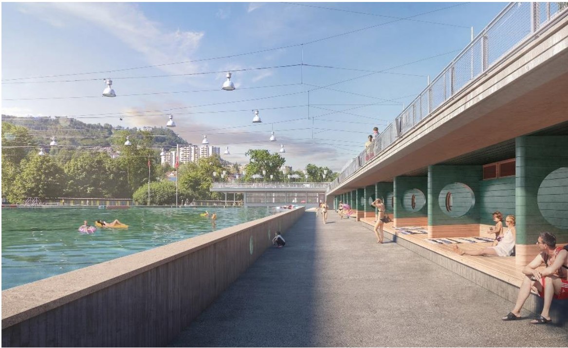
Abb. 6: Visualisierung Nichtschwimmbecken/Eisbahn und Liegeflächen

Im Gebäudeinneren, im Bereich der freierwerdenden Fläche der Garderoben, wird ein Mehrzweckraum geschaffen. Ebenfalls im Erdgeschoss des Garderobentrakts werden die Garage der Eisreinigung mit einer Schmelzgrube und die Werkstatt kombiniert. Zusammen mit den Betriebsräumen im 1. Obergeschoss liegen diese Nutzungen kompakt beieinander, was ideal für die betrieblichen Abläufe ist. Die bestehenden Garderoben im 1. Untergeschoss für den Club-Eishockey werden so weit wie im Bestand machbar nach Vorgaben für untere Ligen saniert. Weiter soll beim Garderobentrakt die Liegefläche im 1. Obergeschoss besser aktiviert werden. Durch eine neue, grosszügige und gut sichtbare Aussentreppe werden diese direkt von der Beckenseite erschlossen. Im Untergeschoss werden die Technikräume den heutigen Bedürfnissen und Vorschriften angepasst.