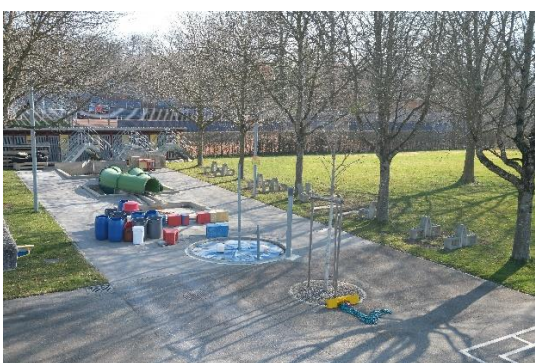
Abb. 4: Kinderplanschbereich