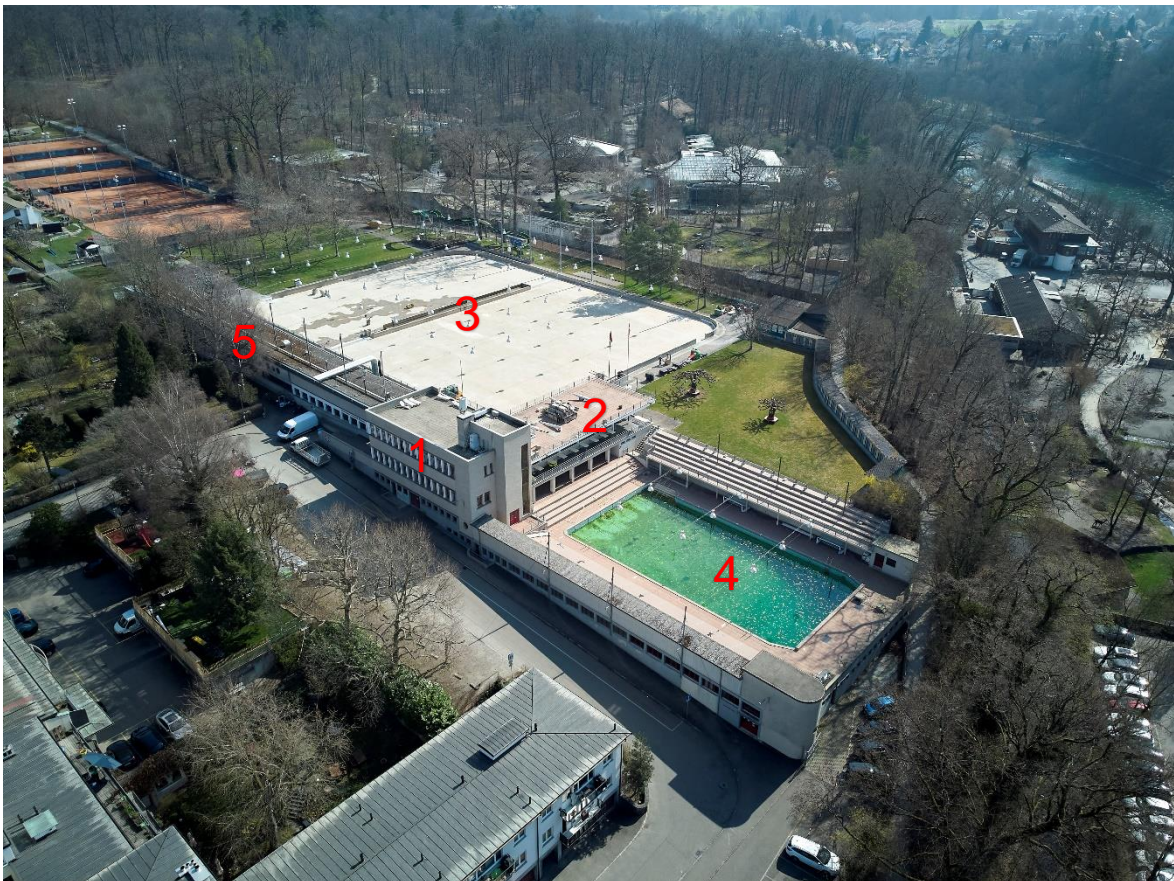
Abb. 1. Luftbild Ka-We-De 2022

Die Ka-We-De wurde zwischen 1932 und 1933 durch die Architekten Rudolf von Sinner und Hanns Beyeler als erste kombinierte Eis- und Wassersportanlage in Bern realisiert. Sie galt damals als pionierhafter Neubau und ist heute ein baukulturell wertvoller Zeitzeuge der Moderne. Im Inventar der städtischen Denkmalpflege ist die gesamte Anlage als schützenswert eingestuft. Sie ist zudem im schweizerischen Kulturgüterschutzinventar als Objekt von nationaler Bedeutung aufgeführt. Die Anlage war ursprünglich als reine Kunsteisbahn geplant, wurde aber bereits in der Planungsphase um ein Wellenbad erweitert und die Eispiste wurde für den Sommerbetrieb als Nichtschwimmbecken umkonzipiert. Die Erschliessung der Anlage erfolgt über die Jubiläumsstrasse und ist im zweigeschossigen Hauptgebäude angesiedelt. Durch den Kassenbereich gelangt man in einen hallenartigen Korridor, von wo die verschiedenen Nutzungen der Ka-We-De zu erreichen sind. Südöstlich stösst im rechten Winkel der Restauranttrakt an das Hauptgebäude und trennt die obere Ebene vom Wellenbad räumlich wie funktionell. Das um ein Geschoss vertiefte Wellenbad ist dreiseitig von Garderobenräumen, Tribünenstufen und Wandelgängen umschlossen. Der an das Hauptgebäude anstossende Garderobentrakt bildet einen baulichen Abschluss gegen die stadtseitig angrenzende Wohnbebauung.