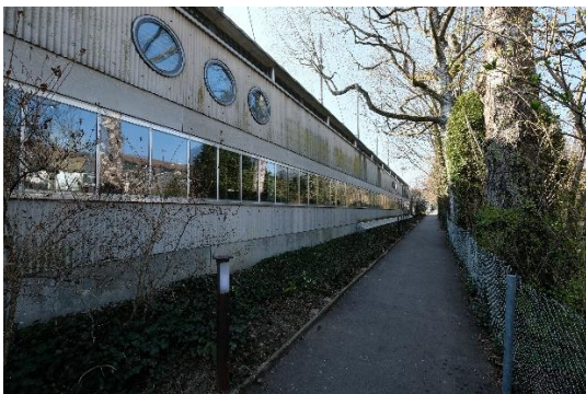
Abb. 2 Nordwestfassade

Aus heutiger Sicht sind die Liegeflächen des Bads zu klein, bieten zu wenig Schattenplätze und die Anzahl der Garderoben sind im Verhältnis zur Liegefläche deutlich zu hoch.