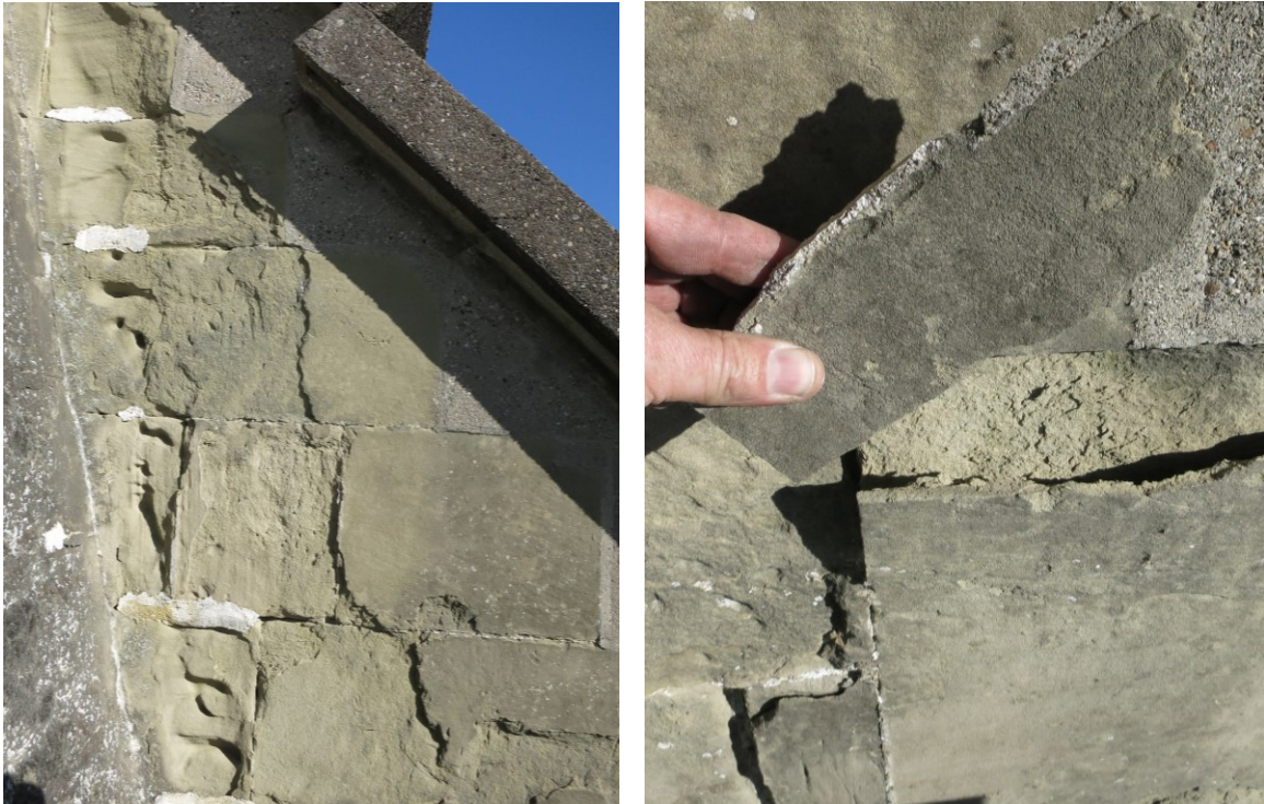
Bild 1 + 2: Ausgewaschene Quader, Schalenbildung und Abplatzungen

Um die Stützmauer in ihrem Bestand zu erhalten und die Gebrauchstauglichkeit sowie Sicherheit langfristig zu gewährleisten, sind nun umfassende Sanierungsmassnahmen notwendig.