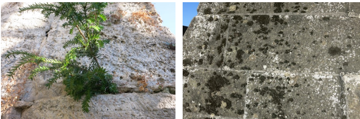
Bild 3 + 4: Pflanzenbewuchs