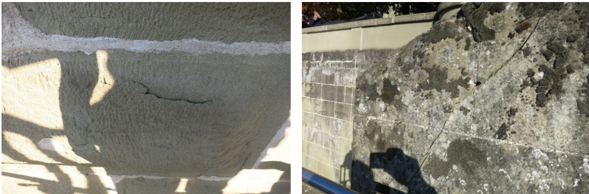
Bild 5 + 6: Schalen- und Rissbildung