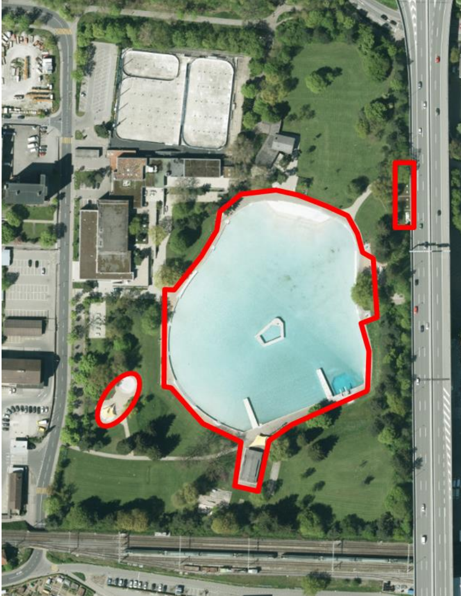
Abb. 1: Bearbeitungsperimeter vorliegendes Projekt

Die Erneuerung der Kunsteisbahn, des Hallenbads und der Umgebung wird als separates Projekt geführt (2013.GR.000373 bzw. PB10-068). Es wird jedoch eng mit dem vorliegenden Projekt Sanierung Freibad geplant und koordiniert. Der Stadtrat hat im September 2018 für die Erneuerung der Kunsteisbahn und des Hallenbads inkl. Umgebung einen Projektierungskredit genehmigt (SRB Nr. 2018-368). Hochbau Stadt Bern hat dazu 2019 einen zweistufigen Projektwettbewerb durchgeführt. Das Siegerprojekt wurde im Dezember 2019 vorgestellt.