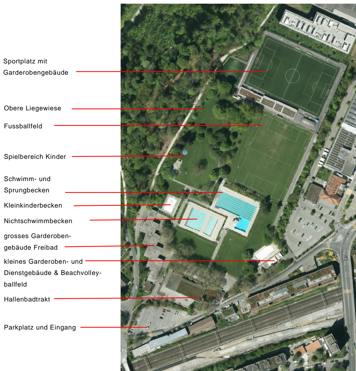
Abb. 1: Wylerbad (Orthofoto 2016)

Die Gebäude der Anlage sind im Inventar der Denkmalpflege nicht aufgeführt. Die Umgebung, respektive der Aussenraum sind jedoch von denkmalpflegerischem Interesse. Das Hallenbad im Wyler ist in wesentlichen Anlagenteilen baugleich mit dem Hallenbad Weyermannshaus.