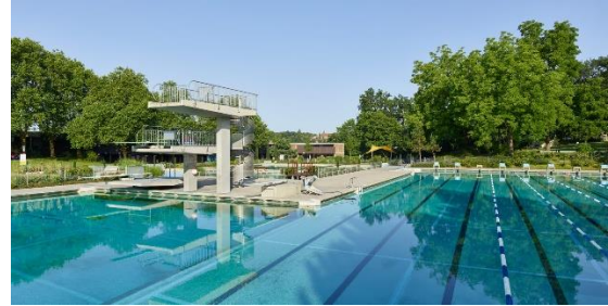
Abb. 3: 50-Meter-Becken mit Sprungturbereich