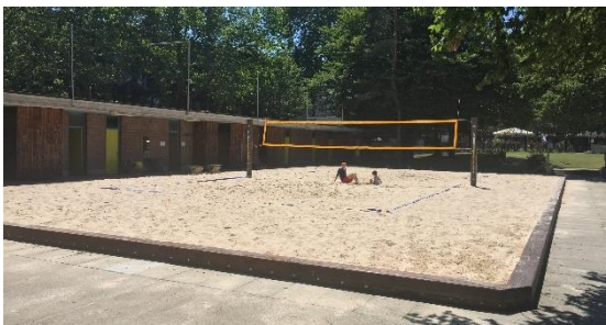
Abb. 6: Kleine Garderobe & ehemal. Lehrschwimmbecken