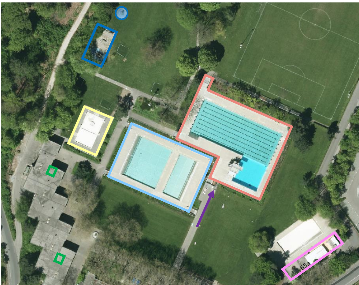
Abb. 10: Lageplan: Kinderplanschbecken (Gelb); Nichtschwimmbecken (Hellblau); Schwimmbecken und Sprungbereich (Rot); Abgang Technik (Pfeil Violett); kleines Garderoben- und Dienstgebäude (Pink); Spielbereich Kinder (Dunkelbau), IV-WC Kabinen (Grün)