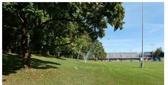
Abb. 9: Fussballfeld & Garderobengebäude Sportplatz