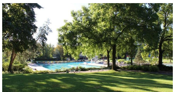
Abb. 7: Liegewiese mit Baumbestand