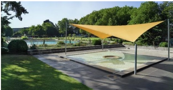
Abb. 4: Kinderplanschbereich