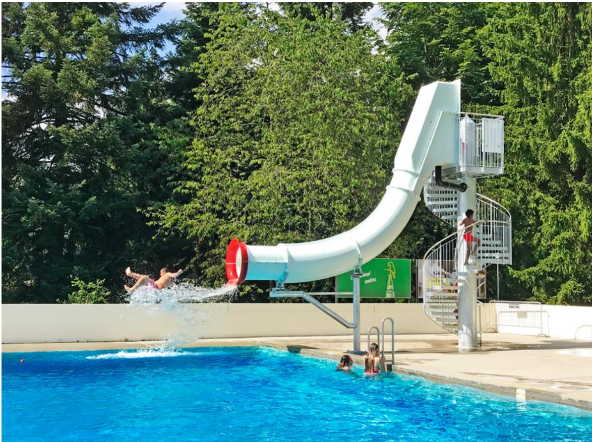
Abb. 12: Beispiel Crazy-Jump im Waldschwimmbad Zimmeregg, Luzern