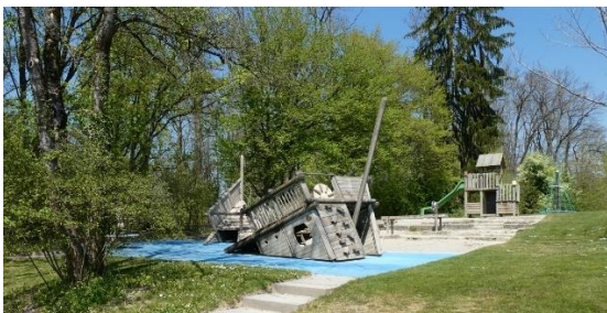
Abb. 8: Spielbereich Kinder