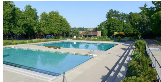
Abb. 5: Nichtschwimmbecken