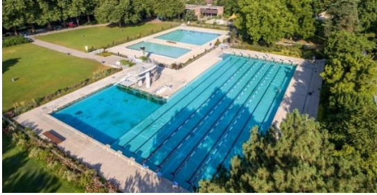
Abb. 2: Vogelperspektive Aussenbeckenanlage

Die gesamte Anlage weist nach fast fünfzig Betriebsjahren ohne umfassende Sanierung wachsende Schäden auf. Die Becken sind undicht und müssen in regelmässigen Intervallen stellenweise behelfsmässig nachgedichtet werden. Die Bausubstanz ist aufgrund der Feuchte teilweise angegriffen und muss saniert werden. Die Badewassertechnik ist veraltet und muss ersetzt werden. Das Kinderplanschbecken entspricht nicht mehr den heutigen Anforderungen und Vorschriften. Auch fehlende Spielmöglichkeiten und veränderte Bedürfnisse von Kindern rechtfertigen eine Sanierung oder Neugestaltung des Kinderbeckens. Die Spielgeräte und der Fallschutz des bestehenden Kinderspielbereichs sind teilweise in einem schlechten Zustand und müssen ersetzt werden. Das kleine Garderoben- und Dienstgebäude im Bereich des ehemaligen Lehrschwimmbeckens weist veraltete haus-technische Installationen sowie eine sanierungsbedürftige Gebäudehülle auf.