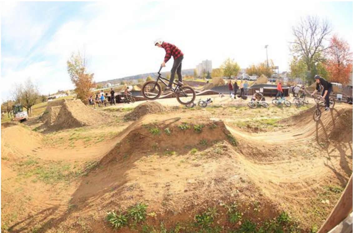
Abbildung 9: Jumptrail in Solothurn

Ein Jumptrail besteht aus aufeinanderfolgenden Absprüngen und Landungen auf einer horizontalen Ebene oder im leichten Gefälle. Das Springen steht im Vordergrund. Die Dimension eines Jumptrails orientiert sich an der Zielgruppe. Jumptrails werden entweder aus Erdmaterial gebaut, asphaltiert oder mit vergleichbarem stabilisiertem Material gefertigt. Ein Jumptrail ist eine spezifische Anlage und wird von geübten Fahrerinnen und -Fahrern genutzt.