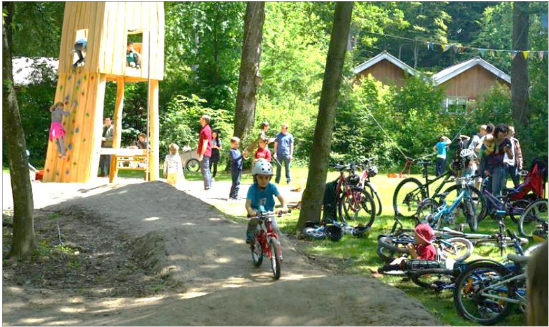
Abbildung 1: Velo-Spielplatz Halenstrasse / Bremgartenwald in Bern