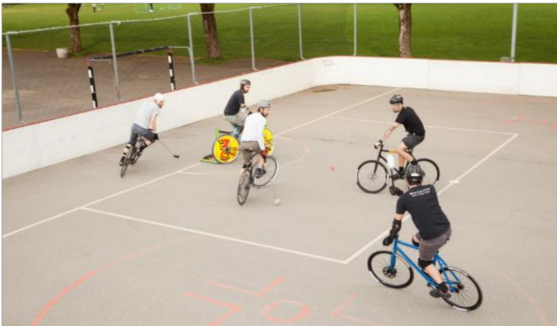
Abbildung 7: Rollplatz für Bike-Polo in Bern

Der fein asphaltierte Platz dient sowohl den Sportarten Roll- und Strassenhockey als auch dem Bike-Polo. Der bestehende Platz auf dem Schulareal Statthalter kann mittelfristig nicht mehr weiterbetrieben werden, weshalb ein neuer Standort gefunden werden muss.