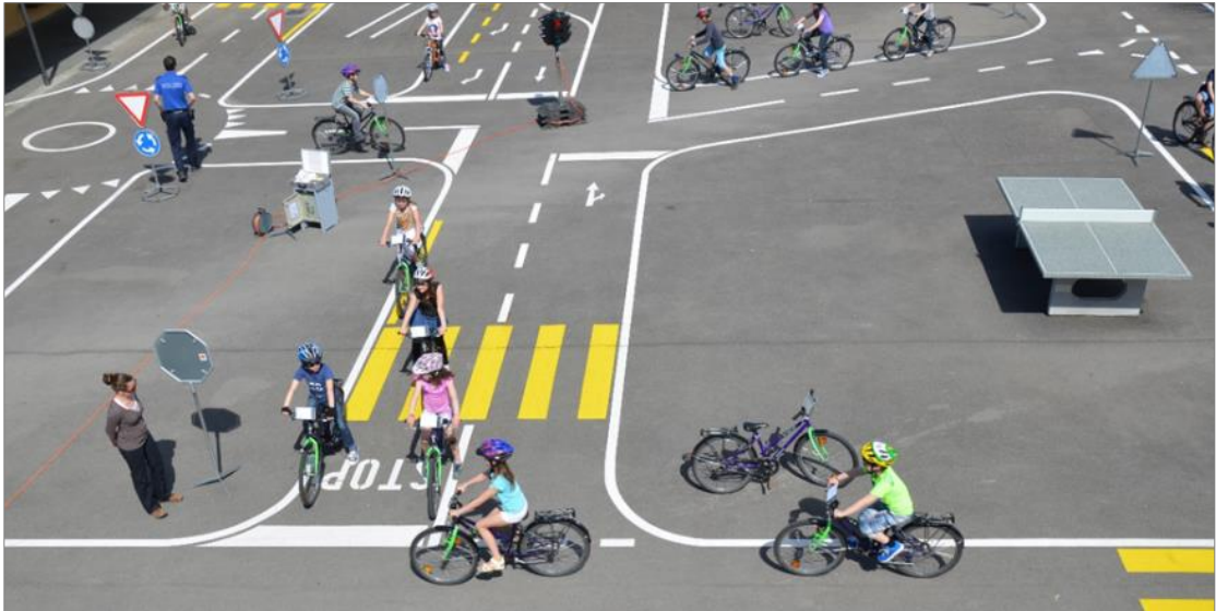
Abbildung 5: Permanenter Verkehrspark in Sempach (LU)

In der Stadt Bern soll es einen fest installierten Verkehrspark für den Verkehrskundeunterricht der Polizei geben, auf dem die Schülerinnen und Schüler auf die Veloprüfung vorbereitet werden können. Ausserhalb der Unterrichtszeiten kann der Verkehrspark durch die Öffentlichkeit genutzt werden, so dass beispielsweise Eltern mit ihren Kindern das Velofahren üben können.