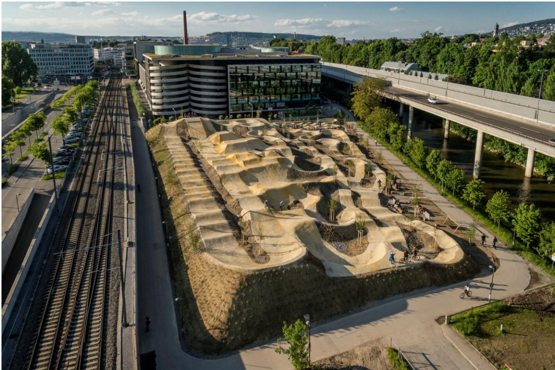
Abbildung 10: Bikepark Sihlcity in Zürich

Im Rahmen der «Tagung Sportanlagen» des Bundesamts für Sport vom 18. April 2018 stellte die Stadt Zürich ihren Bike- und Freestylepark vor. Gemäss dem Leiter der Fachstelle Sportanlagen Zürich ist die Anlage bei der «Sihlcity» im Verhältnis zu den Nutzungsstunden eine der günstigsten Sportanlagen der Stadt. Es handle sich um eine äusserst beliebte Anlage mit Ausstrahlung in die Region. Auf dem Bike- und Skatepark hat sich schnell eine vielfältige Szene entwickelt. Neben Eltern mit Kindern und Teenagern trainieren auch Profis. Aufgrund der Durchmischung findet eine gute soziale Kontrolle statt und es treten gemäss den Aussagen des Verantwortlichen beim Sportamt praktisch keine Probleme mit den Nutzenden auf.