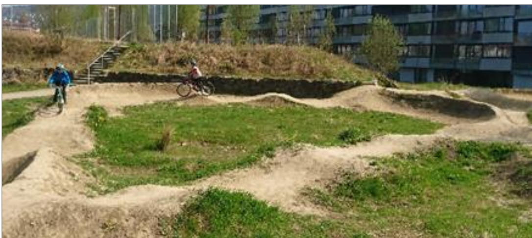
Abbildung 4: Pumptrack Weissenstein in Bern (unbefestigt)