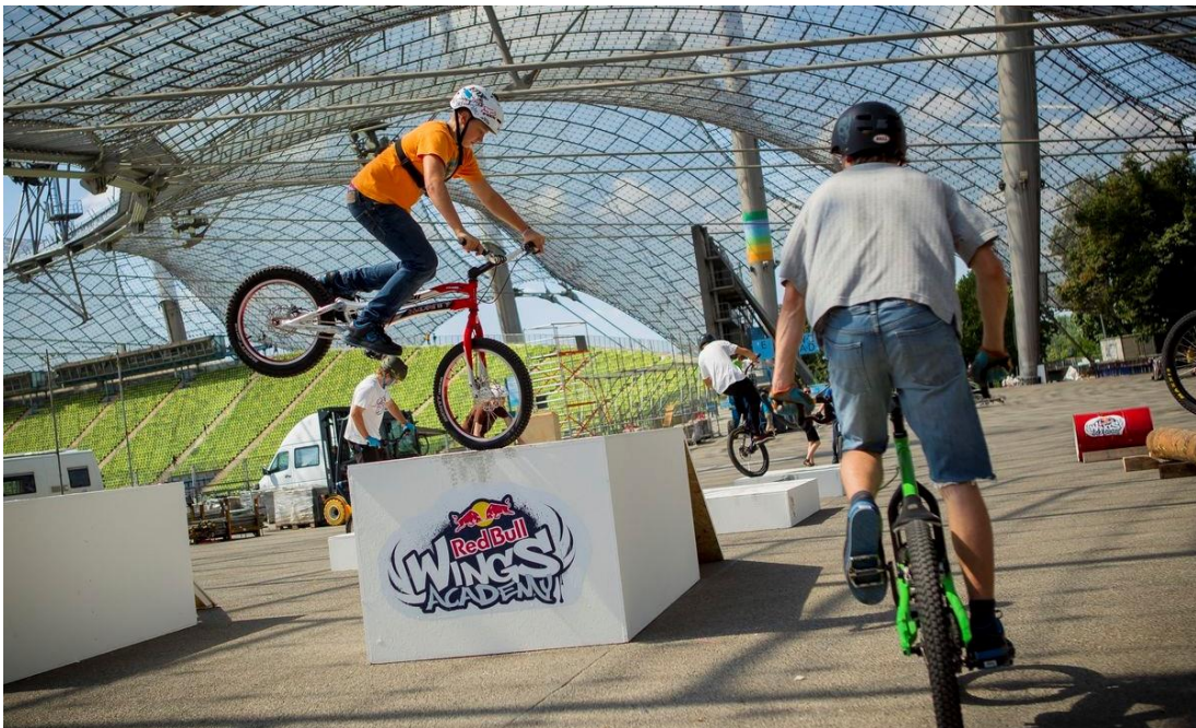
Abbildung 8: Temporärer Trial-Park in München

Beim Street-Trial werden mit speziellen Fahrrädern auf dem Parcours insgesamt nur geringe Distanzen zurückgelegt. Es wird vor allem eine Art Geschicklichkeitsparcours absolviert. Im Vordergrund stehen «Balance und Tricks».