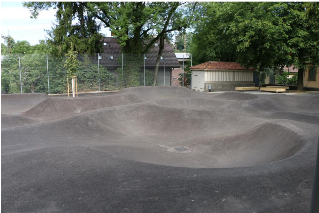
Abbildung 2: Rollpark Lorraine in Bern

Ein Rollpark ist eine asphaltierte Landschaft aus Wellen und Mulden, die mit verschiedenen Rollsportgeräten befahren werden kann. Es gibt nicht nur eine Fahrspur, sondern die Kinder und Jugendlichen können ihren Weg selber wählen.