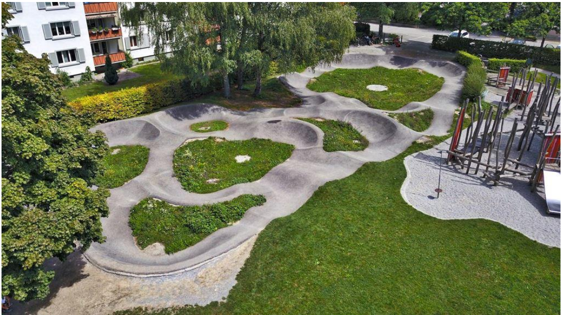
Abbildung 3: Pumptrack in Chur (GR) (befestigt)

Pumptracks können sowohl aus Asphalt (befestigt) als auch aus Erdmaterialien (unbefestigt) gebaut werden. Aufgrund der vielen Vorteile von befestigten Anlagen, was den Unterhalt und die Nutzung im Winter oder bei Schlechtwetter anbelangt, sind im vorliegenden Konzept vor allem befestigte Anlagen geplant.