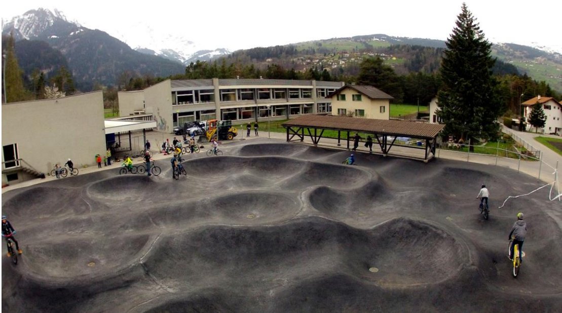
Abbildung 6: Rollsportanlage Sils (GR)