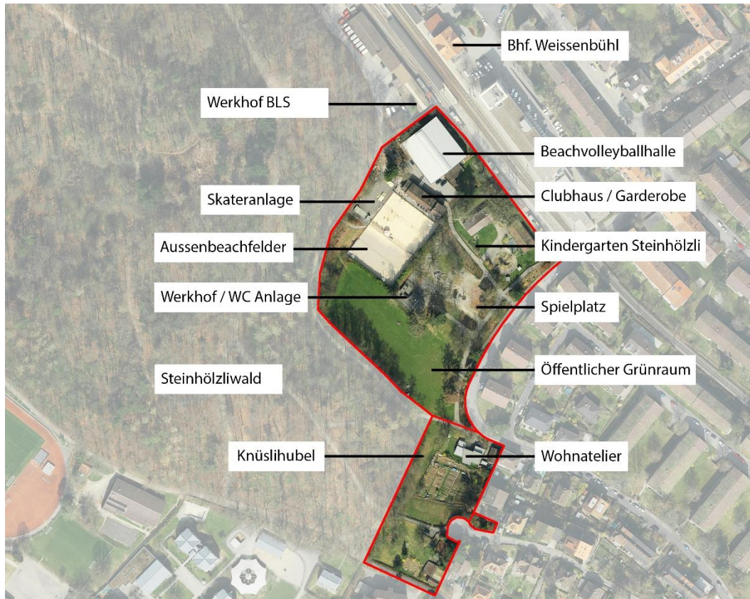
Luftbild: Städtische Parzellen GBBi.-Nr. 920/III Goumoënsmatte und GBBi.-Nr. 2856/III Knüslihubel (Web-GIS)

termonaten bestehen Engpässe, ein Ausbau der Kapazität ist aus Sicht des Beachcenters anzustreben. Die heutige Sportnutzung ist allerdings nicht zonenkonform. Das unselbständige Baurecht und die befristete Baubewilligung für die vom Beachcenter Bern im 2009 erstellte Halle laufen im Jahr 2020 aus. Für die Weiterführung der heutigen Nutzungen ist somit eine Anpassung des Zonenplans mit Volksabstimmung notwendig. Für die Zeit bis zur Volksabstimmung ist eine Verlängerung der Ausnahmegewilligung einzuholen.