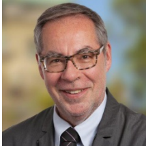
Alexander Tschäppät, Stadtpräsident

„Bern ist eine Weltstadt – nicht so sehr aufgrund ihrer Grösse, wohl aber dank ihrer Vielfalt. Ich bin stolz darauf, Stadtpräsident für Menschen aus über 160 Nationen zu sein und setze mich gemeinsam mit meinen Mitarbeitenden dafür ein, diese Vielfalt zu pflegen.“