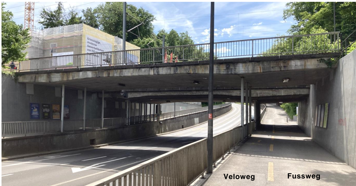
Abb. 1 (Blickrichtung Köniz): Ansicht der Brücke und der darunter liegenden Stützmauern entlang der Schwarzenburgstrasse; dahinter liegend die Eisenbahnbrücke (diese ist Eigentum der BLS und nicht Gegenstand des vorliegenden Antrags).

Die Stützmauern entlang der Schwarzenburgstrasse weisen lokale Schadstellen auf, zudem sind die dortigen Geländer nach aktuell gültigen Normen zu niedrig.