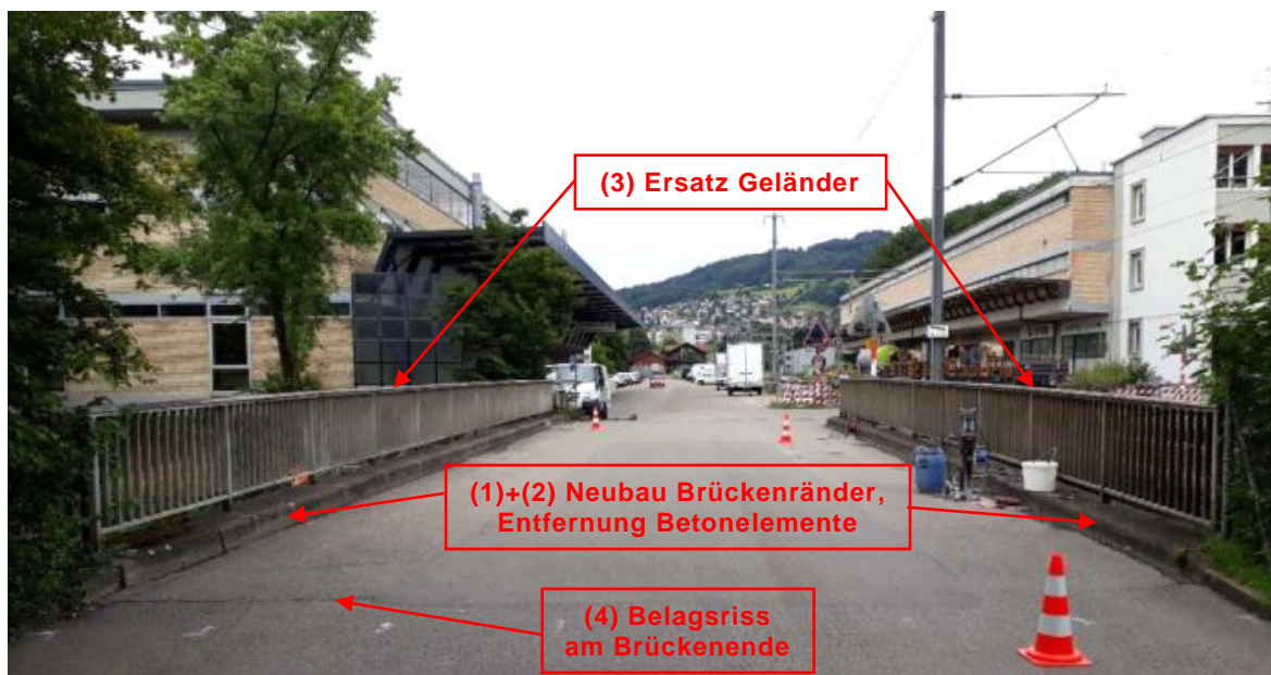
Abb. 3: Geplante Massnahmen an der Brückenplatte.

Neben vereinzelt statischen Verstärkungsmassnahmen werden vor allem die schadhafte Brückenränder (1) instandgesetzt. Dabei werden die äusseren Betonschichten abgetragen und die Betonelemente am Rand (2) entfernt. Anschliessend werden die Brückenränder neu betoniert. Die bestehenden Brückengeländer (3) werden durch normkonforme Geländer ersetzt.