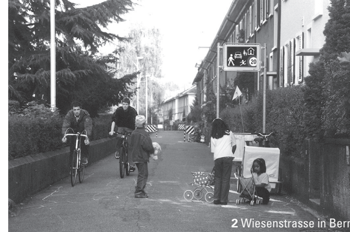
2 Wiesenstrasse in Bern