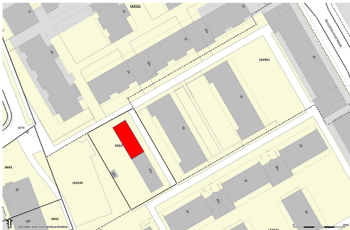
Situation des bestehenden Kindergartens (Nr. 32a) mit geplantem Erweiterungsbau (rot)