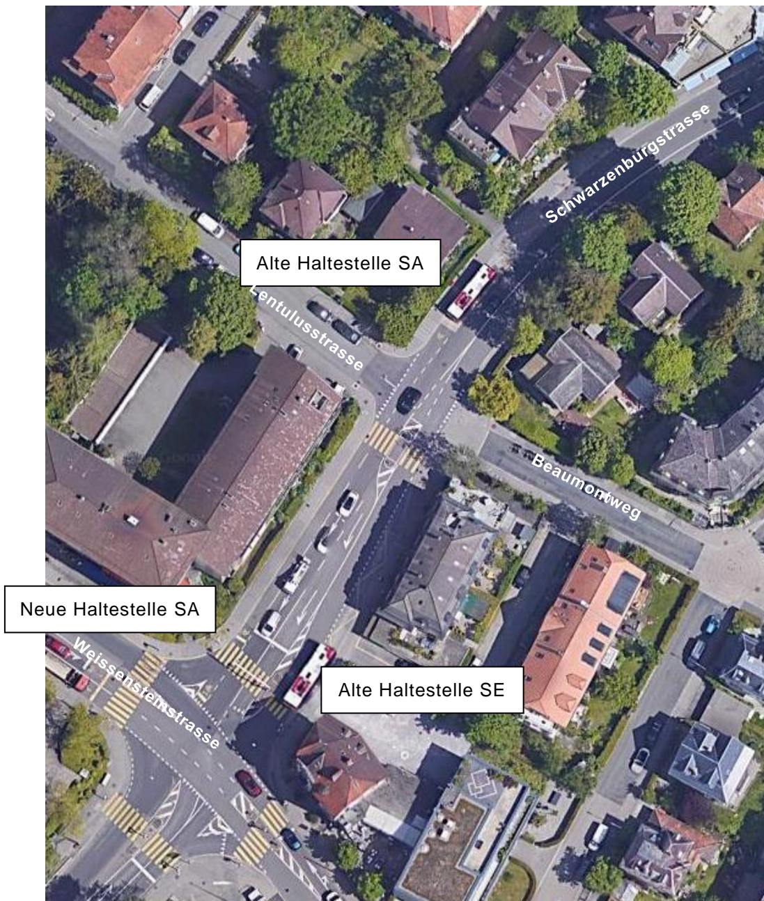
Abbildung 2: Haltestelle Weissensteinstrasse stadtein- (SE) und stadtauswärts (SA) – alter und neuer Standort

Stadteinwärts können die Doppelgelenktrolleybusse die bestehende Haltestelle ohne Schwierigkeiten anfahren, es besteht also kein zwingender Anpassungsbedarf. Velos und der motorisierte Individualverkehr (MIV) können haltende Busse überholen. Da die Haltestelle eine Buchtform aufweist, kann sie nicht hindernisfrei ausgestaltet werden (Problematik des «Überstreichens» der Busse).