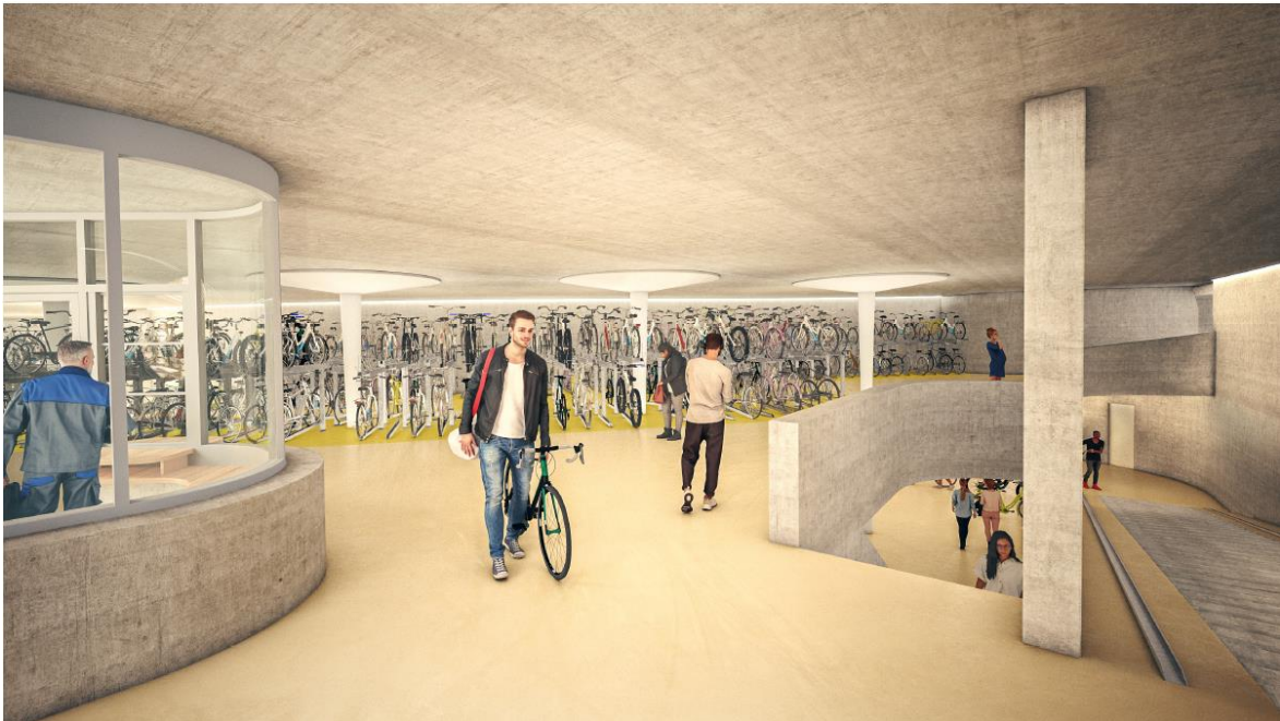
Abb. 2: Visualisierung Eingang Velostation 1. UG, rechts der Abgang zum 2. UG (ikonaut, im Auftrag von Tiefbau Stadt Bern)