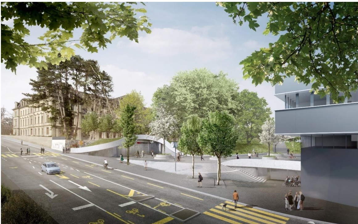
Abb. 1: Visualisierung des neuen Bahnhofzugangs Länggasse. Die Velostation wird unter der Treppenanlage gebaut, der Zugang erfolgt im Bereich der Velofahrenden unten rechts im Bild (ikonaut, im Auftrag der SBB).

Die neue Velostation kommt unter der Treppenanlage südlich des neuen Bahnhofzugangs Länggasse zu liegen. Sie grenzt direkt an die bestehende Velostation Schanzenbrücke und soll mit dieser verbunden werden. Der Zugang zur neuen Velostation erfolgt über die Schanzenstrasse (siehe Visualisierung) und wird mit Schiebetüren und einem betreuten Empfang ausgerüstet. Weiter wird die Beschaffung eines automatischen Zutrittskontroll- und Bezahlsystems sowie eines Informations- und Leitsystems für alle Velostationen geprüft, diese ist aber nicht Bestandteil des vorliegenden Ausführungskredits. Die Zufahrtssituation von der Schanzenstrasse her wird mit der Umsetzung der städtischen Bau- und Verkehrsmassnahmen ZBB wesentlich verbessert.