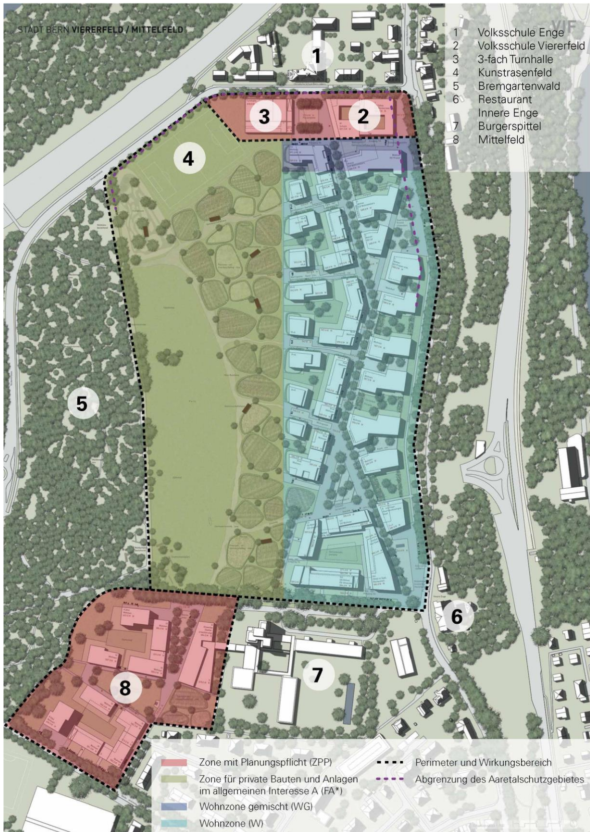
Situationsplan Siegerprojekt «VIF!» (Ammann Albers Stadtwerke / raderschallpartner Landschaftsarchitekten / huggenbergerfries Architekten / Basler & Hofmann / zeugin.gölker.immobilienstrategien)