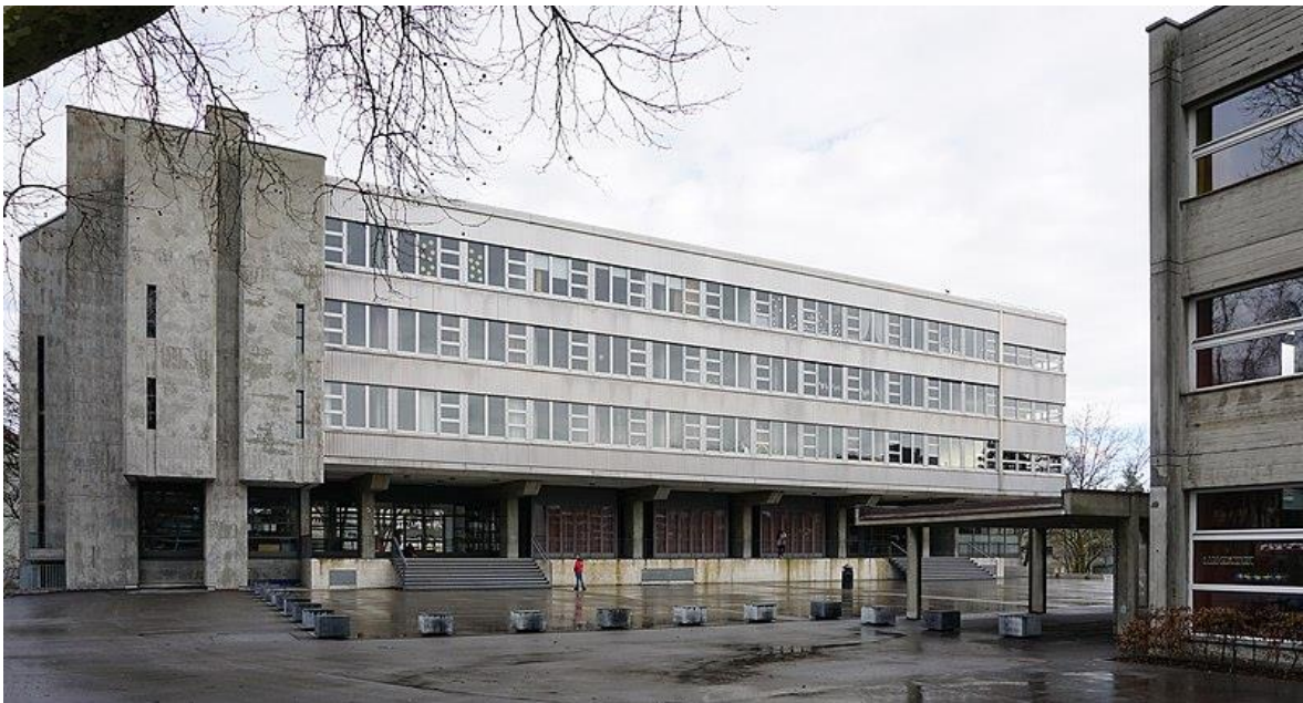
Südwestfassade der Fellerstrasse 18

Das Terminprogramm sieht die Planungsphase der Gesamtsanierung ab März 2024 vor.