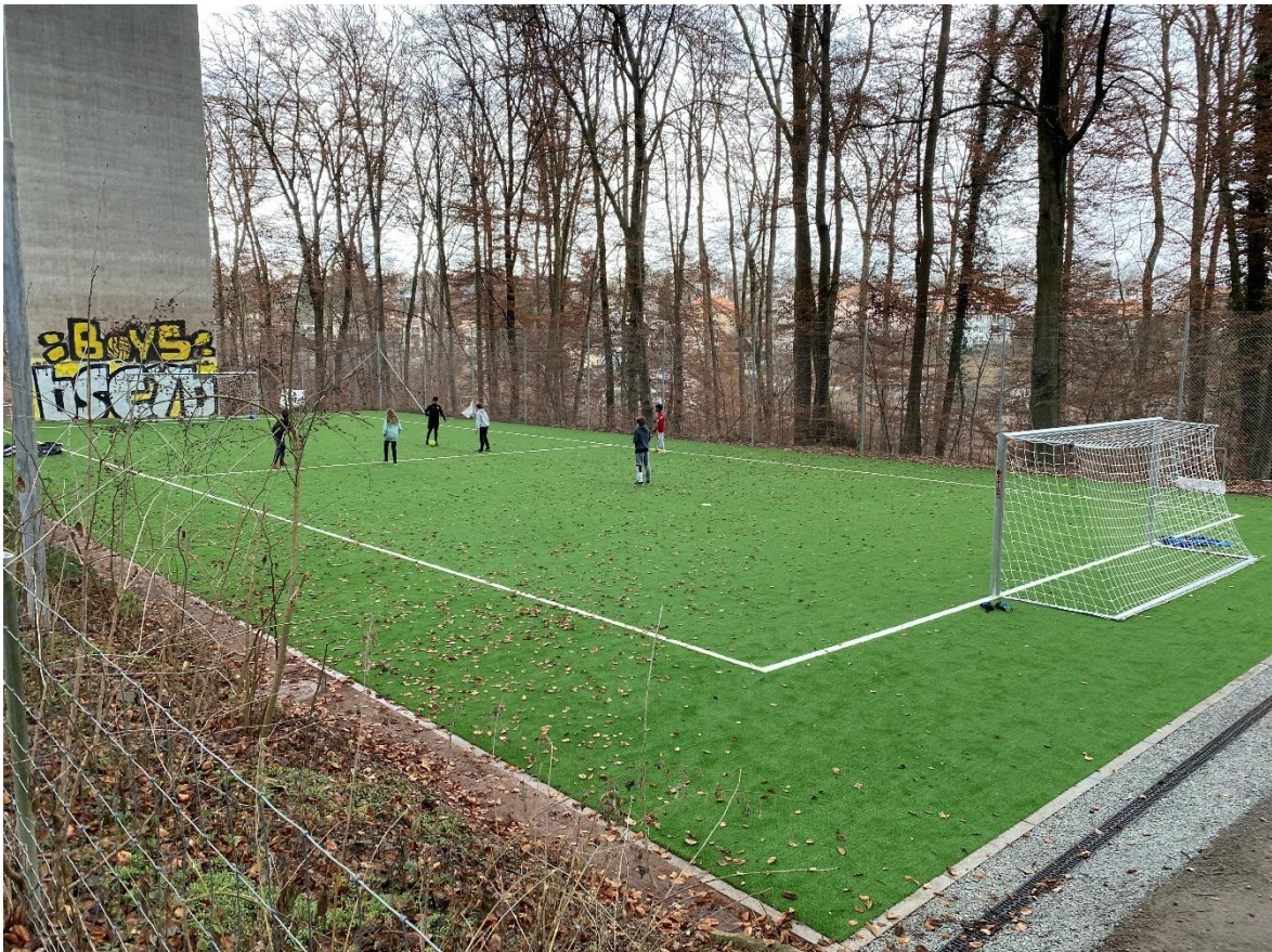
Foto des im Jahr 2021 umgewandelten 1. Kunstrasenspielfeld