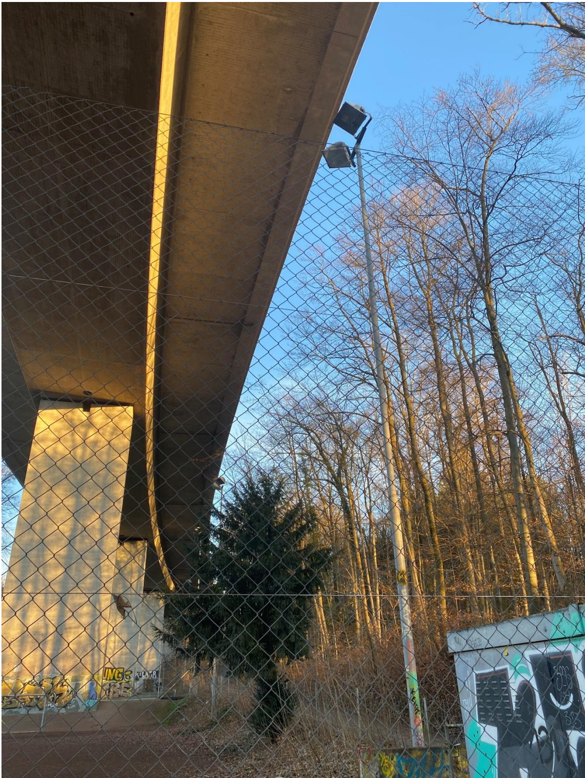
Bestandsplatzbeleuchtung und Situation Platz in Waldnähe, rechts unten das Bestands-WC

Aus ökologischen Gründen wurde wieder ein Kunstrasenspielfeld «Typ unverfüllt» geplant. Diese Wahl entspricht dem städtischen Konzept, wonach für neue Anlagen oder bei Ersatz von bestehenden Feldern möglichst ein unverfüllter Kunstrasen oder ein Kunstrasen mit einer ökologisch vertretbaren Verfüllung gewählt werden soll.