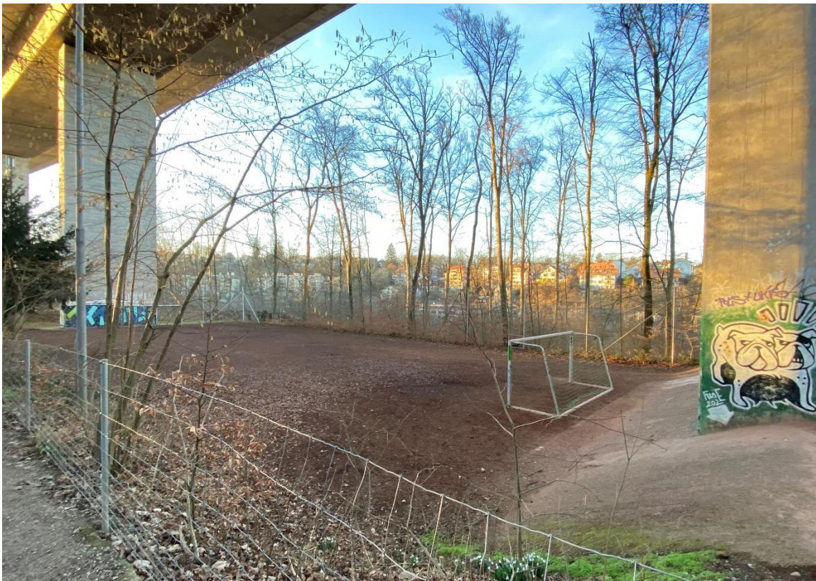
Heute bestehender Allwetter-Hartplatz unter dem Autobahnviadukt

Die heutige Spielfeldgrösse von ca. 43m x 21m wird beibehalten und maximal ausgenutzt. Das vorhandene Zugangstor und die Platzzufahrt sollen auf drei Meter verbreitert werden, um die Zufahrt der Maschine für die Pflege und weiterer Unterhaltsgeräte zu ermöglichen. Der bestehende Ballfangzaun wird instandgesetzt und nur wo notwendig erneuert. Die vorhandene Platzbeleuchtung wird ebenfalls instandgesetzt. Es ist zudem eine Umrüstung auf LED geplant. Die südliche Böschung des Platzes soll mit einheimischen Waldstauden bepflanzt werden, um den heute offenen Erdboden zu schliessen und somit die Böschung vor Erosion zu schützen, den Sandeintrag auf das Spielfeld zu minimieren und ungewünschten Bewuchs zu verhindern. Die Planung des neuen Platzes ist auf ein Minimum an Unterhaltsaufwand ausgelegt.