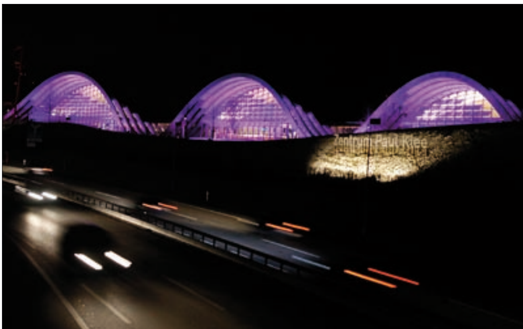
Neues wagen in Kunst und Kultur: Das Zentrum Paul Klee in Bern.