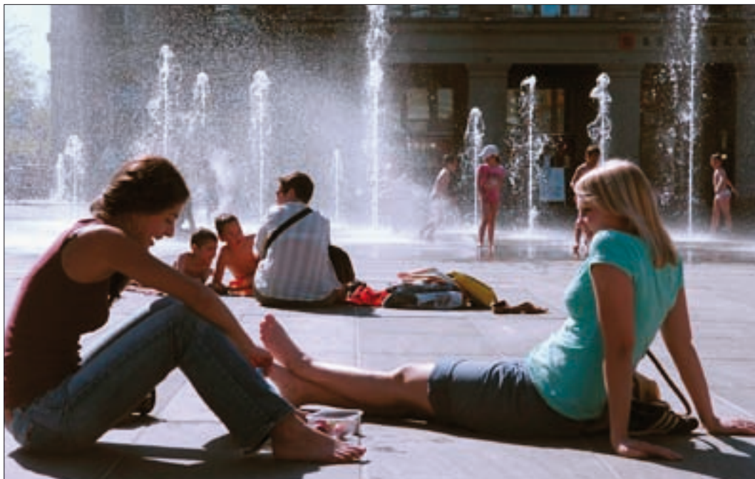
Lebensqualität hoch zwei: Mittagspause auf dem Bundesplatz.

Bern verbindet als Unesco-Welterbe auf einzigartige Weise urbanes, modernes Lebensgefühl und Weltoffenheit mit kleinräumiger Beschaulichkeit, Nähe und Bodenständigkeit. Die Stadt weckt Sympathien, vermittelt Heimatgefühl und Geborgenheit, ist für die Bernerinnen und Berner eine Herzenssache, für Touristen und Besucherinnen und Besucher ein Ort der schönen Erinnerung und für Künstler und Lebenskünstler eine Werkstatt des Nonkonformismus.