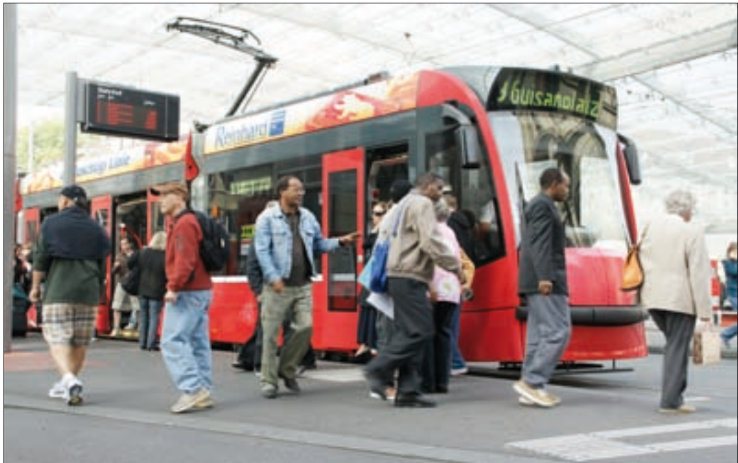
Tram-Stadt Bern: Ohne öffentlichen Verkehr geht gar nichts mehr.

Die Stadt Bern nimmt beim ökologischen Umbau eine Vorreiterrolle ein. Sie fördert konsequent die Produktion erneuerbarer Energie und die Energieeffizienz und ist ein wichtiger Forschungs- und Entwicklungsstandort für neue Energietechnologien und integrierte Ressourcenwirtschaft.