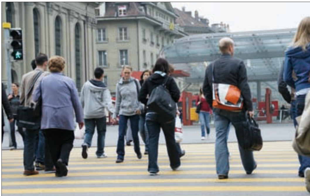
Bern als Wirtschaftsmotor: Pendlerstrom auf dem Bahnhofplatz.

Bern ist der Wirtschaftsmotor des Kantons und das Verwaltungszentrum der Schweiz. Dank hoch qualifizierten Arbeitsplätzen, dank leistungsfähigen Unternehmen im Medizinal- und Energiebereich, dank einem Cluster von politiknahen Branchen und dank einem starken öffentlichen Sektor mit Verwaltung, Service-public und öffentlich-rechtlichen Anstalten zeichnet sich Berns Wirtschaft durch hohe konjunkturelle Resistenz aus. Der Dia-