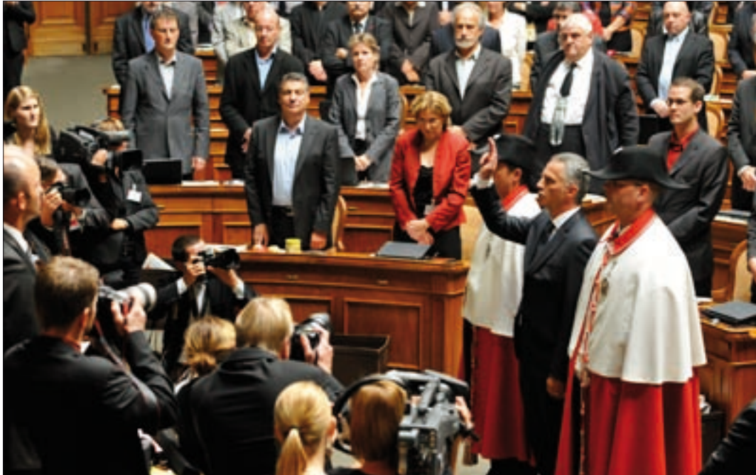
Politzentrum Bern: Hier wird über die Zukunft der Schweiz entschieden.

Bern nimmt als Bundeshauptstadt eine Sonderstellung ein. Hier ist der Ort, wo die Weichen für die Schweiz gestellt und die Grundlagen für die ökonomische, soziale und ökologische Entwicklung des Landes geschaffen werden. Hier steht jene spezifische Infrastruktur mit Verwaltung, Botschaften, Service-public, Lobbying-Organisationen und Beratungsfirmen, die ein Regierungszentrum ausmacht. Und hier lebt und arbeitet ein beträchtlicher Teil jener hoch qualifizierten Fachleute und Verwaltungsexpertinnen und -experten, die politische Denkarbeit leisten und die Entscheide von Regierung und Parlament vorbereiten. In diesem Sinne ist Bern ein wissensintensives