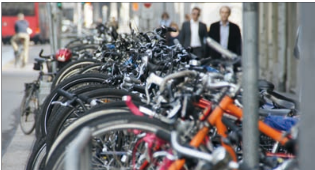
Velo-Stadt Bern: Veloparking am Bollwerk.