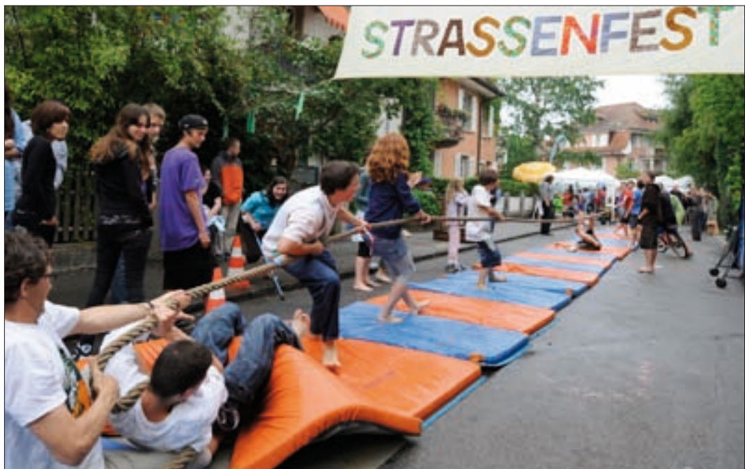
Das Quartier als Lebenszentrum: Spielplausch für Alt und Jung.