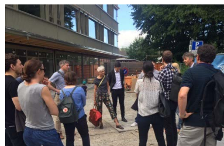
Tour de Berne 20.6.2019: Die PVS beim neu erstellten Marzili Schulhaus.