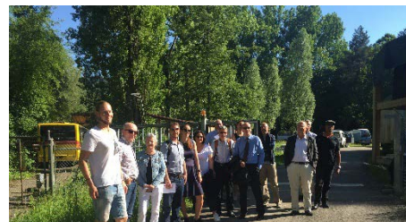
FSU-Ausflug 17.6.2019: Besichtigung Gaswerkareal.