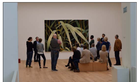
Bilder Joel Leber