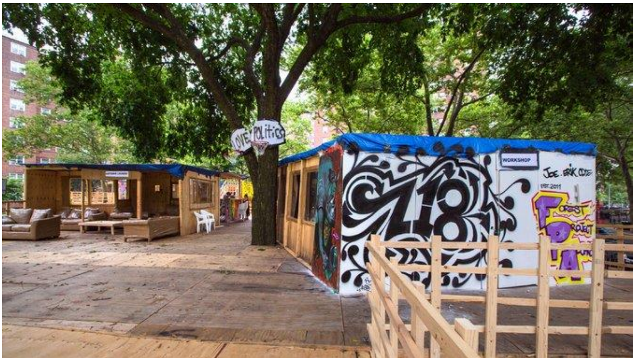
Abbildung 3: Thomas Hirschhorn's «Gramsci Monument», Foto: Ángel Franco/ The New York Times 44

Micro-Utopien 43 sind temporäre Manifestationen einer idealen Gesellschaft, welche durch die Teilnehmenden geschaffen werden. Somit können politische Überzeugungen, gesellschaftsrelevante Prozesse oder progressive Formen der sozialen Interaktion ausprobiert, gelebt und veranschaulicht werden. Das Ziel von Micro-Utopien ist es, die imaginierten Grenzen und Möglichkeiten in einer Gesellschaft durch eine positive, gemeinschaftliche Erfahrung zu verschieben. Gegebene soziale, politische und wirtschaftliche Bedingungen unsere Gesellschaft werden hinterfragt und es werden durch die Teilnahme an bzw. Konfrontation mit einer Micro-Utopie neue gesellschaftliche Vorstellungen und Imaginationen erzeugt. Eine Micro-Utopie ist somit ein sehr kreatives Werkzeug, welches den Beteiligten sehr viel Spielraum und Gestaltungsfreiheit gibt. Für die Realisierung eines konkreten Projekts wird normalerweise sehr offen eingeladen, es besteht aber auch die Möglichkeit eine bestimmte Gruppe oder ein bestimmtes Thema auszuwählen.