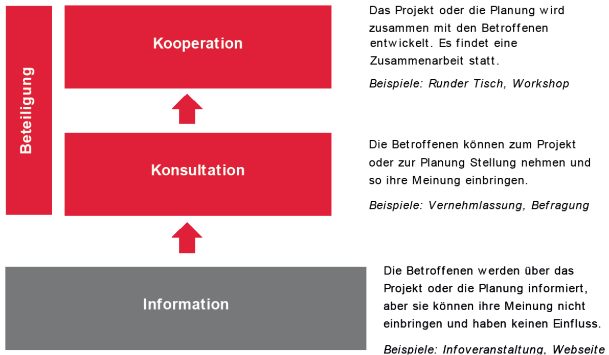
Abbildung 1: Formen der Beteiligung in der Arbeitshilfe «Mitreden & Mitgestalten» der Stadt Bern 8

Das Partizipationsverständnis der Stadt Bern baut grundsätzlich auf einem Stufenmodell auf. Der Gemeinderat anerkennt, dass 'echte' Partizipation erst nach der Information stattfindet: In vielen Projekten « [...] wird oftmals die Information als erste Stufe der Partizipation definiert. Auf der Stufe Information können die Betroffenen ihre Meinung nicht einbringen und können keinen Einfluss auf das Projekt oder die Planung nehmen. Bei städtischen Projekten und Vorhaben wird deshalb erst dann von Partizipation gesprochen, wenn die Stufe Information überschritten wird.» 6 Die Stufen Konsultation und Kooperation bekommen in den Partizipationsbemühungen der Stadt Bern eine grosse Relevanz. Aber auch die Stufen Konsultation und Kooperation beinhalten keine Zugeständnisse von Entscheidungskompetenzen. Der Gemeinderat definiert klar, dass städtische Partizipation ohne jegliche Weitergabe von Entscheidungsmacht stattfindet: « Die Entscheidungshoheit liegt bei der Konsultation sowie der Kooperation weiterhin beim zuständigen Organ (z. B. Gemeinderat). » 7