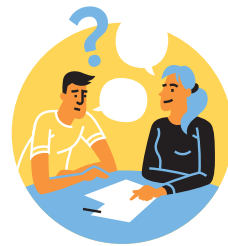
Information und Beratung

Bei untenstehenden Handlungsfeldern wurde hingegen eine andere Gewichtung vorgenommen: