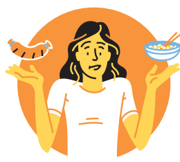
Gesundheit und Prävention