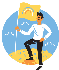
Begleitung Aneignung von Räumen

Im Laufe der Konzeptarbeit haben sich die involvierten Gremien (Projektleitung, Projektteam und Steuergruppe) intensiv mit den Handlungsfeldern auseinandergesetzt, in welchen sich der toj prioritär engagieren soll. Massgebend dabei waren der sozio-kulturelle Bedarf, die beim toj vorhandenen oder potenziellen Kompetenzen und die aktuell vorhandenen Ressourcen. In folgenden Handlungsfeldern will der toj Schwerpunkte setzen und sich als zentraler Akteur der offenen Jugendarbeit profilieren: