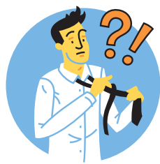
Übergang Schule - Ausbildung