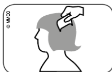
Illustration du point 4