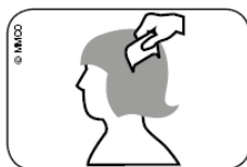
Fig. Pettinare i capelli bagnati con il pettine per pidocchi dall’attaccatura fino alle punte dei capelli