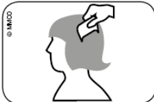
Resim: Islak saçın bit tarağı ile saç kökünden uçlarına kadar taranması