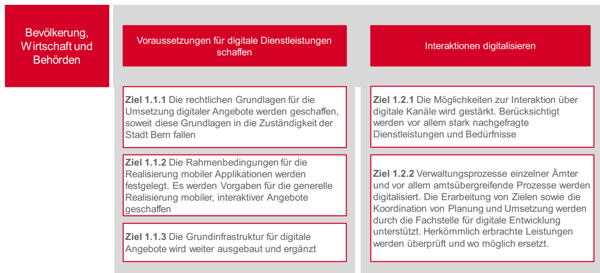
Abbildung 2 Der Zugang zu den Verwaltungsangeboten der Stadt wird auf digitaler Basis zunehmend direkt und unkompliziert gestaltet

Dienststellen werden durch die Fachstelle Digitale Entwicklung unterstützt. Herkömmlich erbrachte Leistungen werden überprüft und wo möglich ersetzt. Damit werden Verwaltungsprozesse in und zwischen den Dienststellen und gegenüber der Bevölkerung sowie Partnerinnen und Partnern zunehmend digital abgebildet.