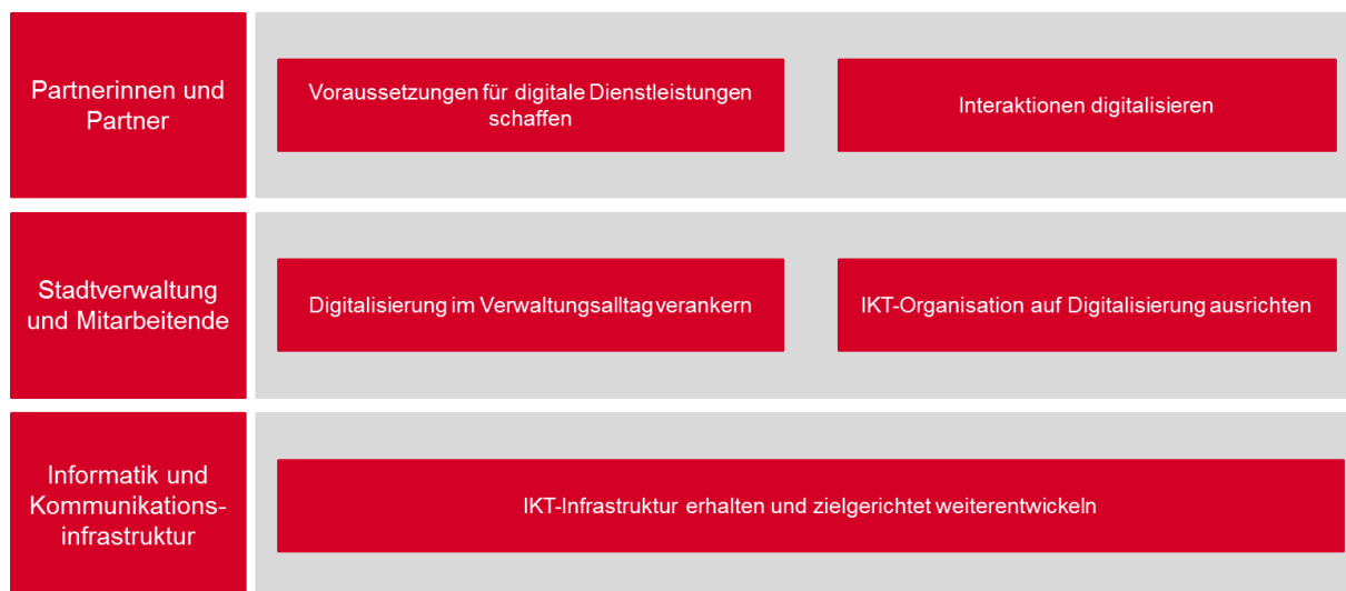
Abbildung 1 Die Ziele orientieren sich an den Sichtweisen der Nutzerinnen und Nutzer