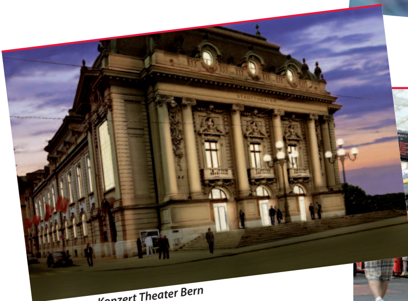
Konzert Theater Bern