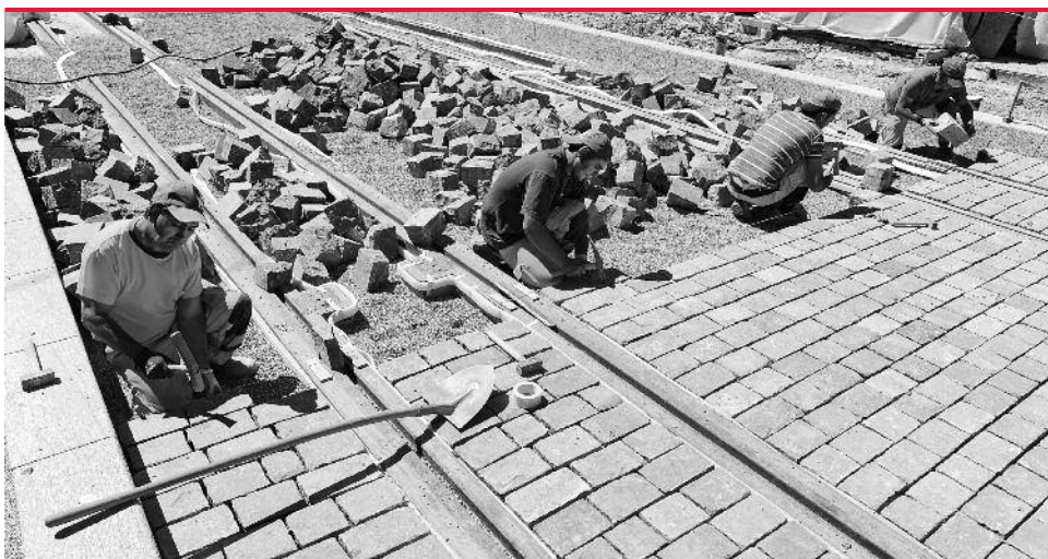
Ob auf der Baustelle oder bei der Datenablage: Ordnung ist das halbe Leben.

Mittlerweile ist das Projekt abgeschlossen, die neue Struktur ist seit Juni in Kraft. «Nun kann man die Daten ohne grossen Aufwand dort ablegen, wo sie hingehören, und findet sie auch wieder», freut sich Hertig. Damit dies auch in Zukunft so bleibt, bestehen klare Vorgaben beim Speichern und Ablegen von neuen Ordnern und Dateien: Der Name der Datei beginnt zwingend mit der Nummer des jeweiligen Strukturpostens. Dieser Pfad erscheint dann auch