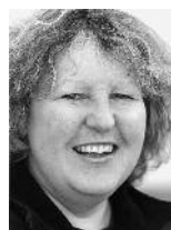
Andrea Trees SUE, Tierpark