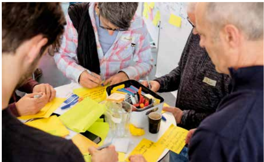
In gemischten Teams Ideen entwickeln: Mitarbeitende an der Ideation Journey.