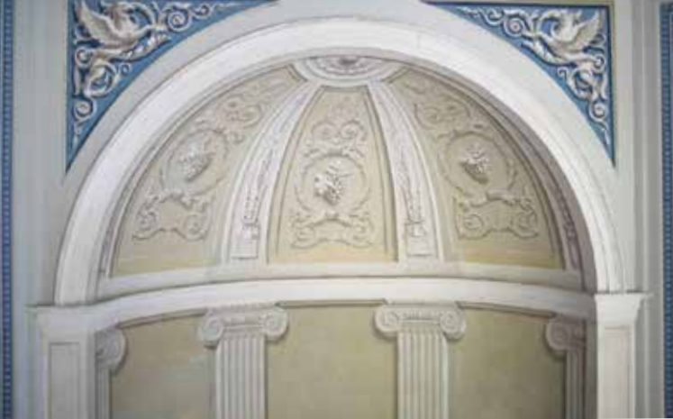
Ecknische mit architektonischer Dekorationsmalerei im blauen Salon des 1. Obergeschosses.

und Massnahmenkartierung sowie von chemischen Untersuchungen originaler Mörtelproben wurde in interdisziplinärer Zusammenarbeit von Spezialistinnen und Denkmalpflege ein Konzept für die nachhaltige Sandsteinkonservierung erstellt. Auch in den bedeutenden Innenräumen des Schlossturms sorgten stratigraphische Untersuchungen für eine fundierte Bestandaufnahme der historischen Raumbooberflächen. Die Analyse der Malschichtenfolge erlaubte die chronologische Zuweisung oder sogar eine Datierung der einzelnen Fassungen, welche die Grundlage für die weiterführende Restaurierung und Rekonstruktion bildete.