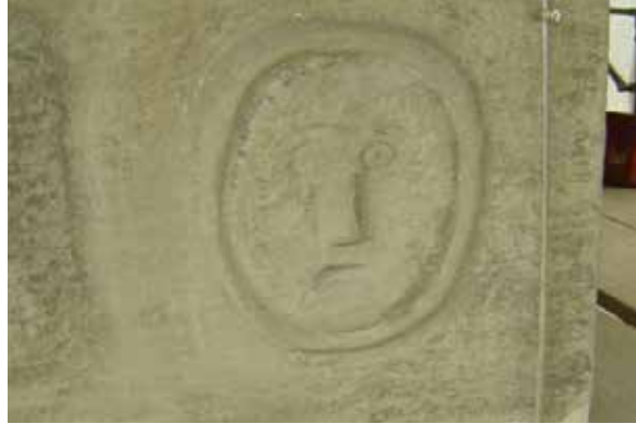
Bildhauerwerkstück Südfassade Schlossturm Holligen, um 1669.

Vereinfacht können zwei grosse Umbauphasen am mittelalterlichen Schlossturm nachgewiesen werden. In der ersten Etappe zwischen 1573–1577 erfolgte der Einbau von mächtigen Rechteckfenstern, die den ehemals geschlossenen Charakter des Turms stark veränderten. In dieselbe Bauphase lässt sich auch der Anbau des filigranen oktogonalen Treppenturms an die Südfassade datieren. Durch das im 16. Jh. angebaute Annexgebäude mit einem weiteren, südseitigen Treppenturm erhielt der Komplex seinen heutigen Schlosscharakter.