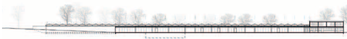
Schnitt Süd M 1 | 1000