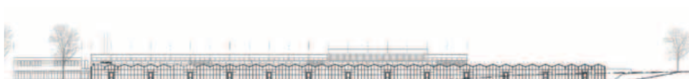
Ansicht Süd M 1 | 1000