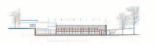
Ansicht West M 1 | 1000