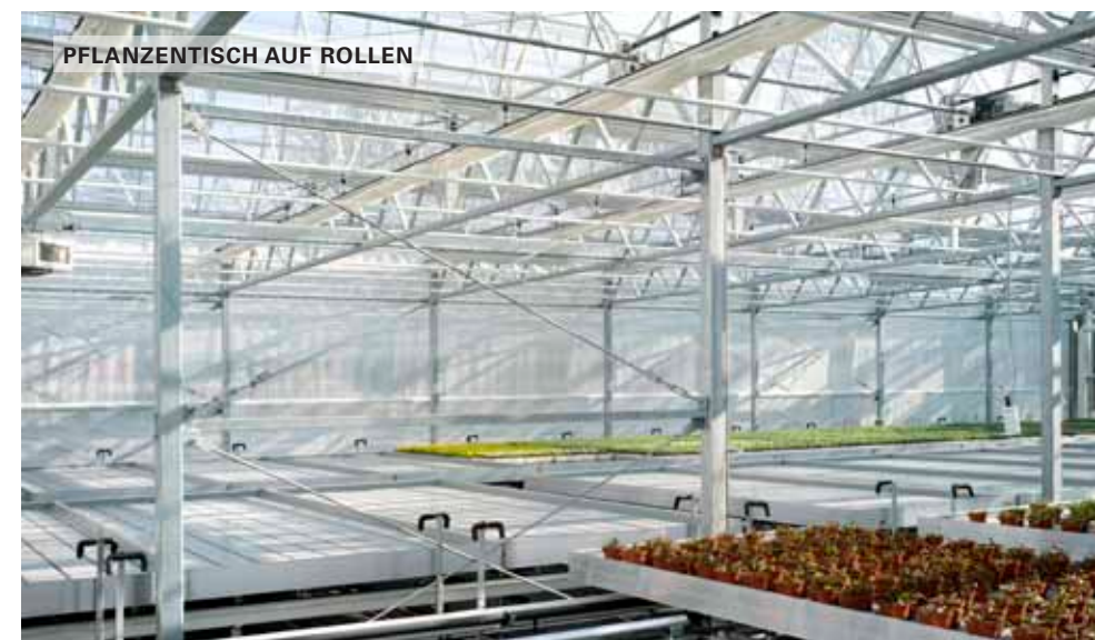
PFLANZENTISCH AUF ROLLEN