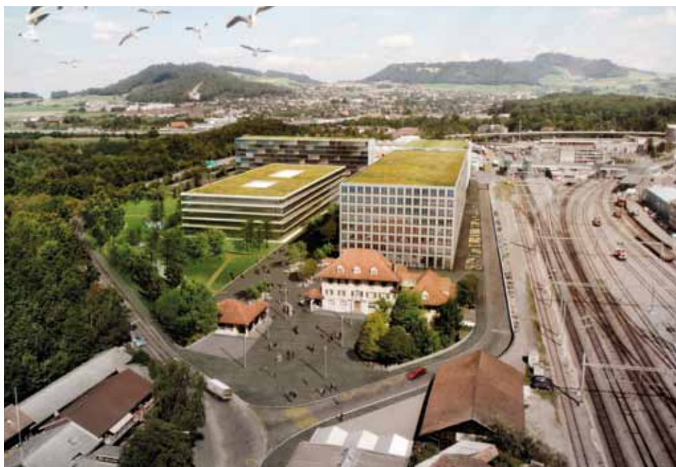
oben: Parkanlage in der WankdorfCity

Gerade in intensiv genutzten und dicht bebauten Gebieten ist die Qualität der Aussenräume besonders wichtig. Der Fonds für Boden- und Wohnbaupolitik der Stadt Bern (Fonds) als Grundeigentümer des westlichen Teils des WankdorfCity-