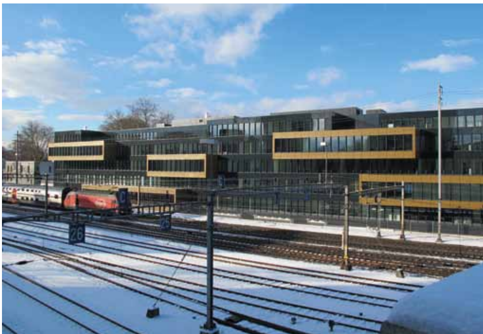
Das «Nautilus»-Gebäude umfasst fünf Stockwerke mit Büroflächen und einer Cafeteria sowie zwei Untergeschosse mit Parkplätzen.