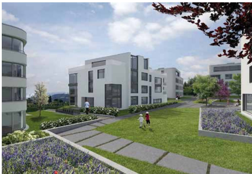
Baufeld G