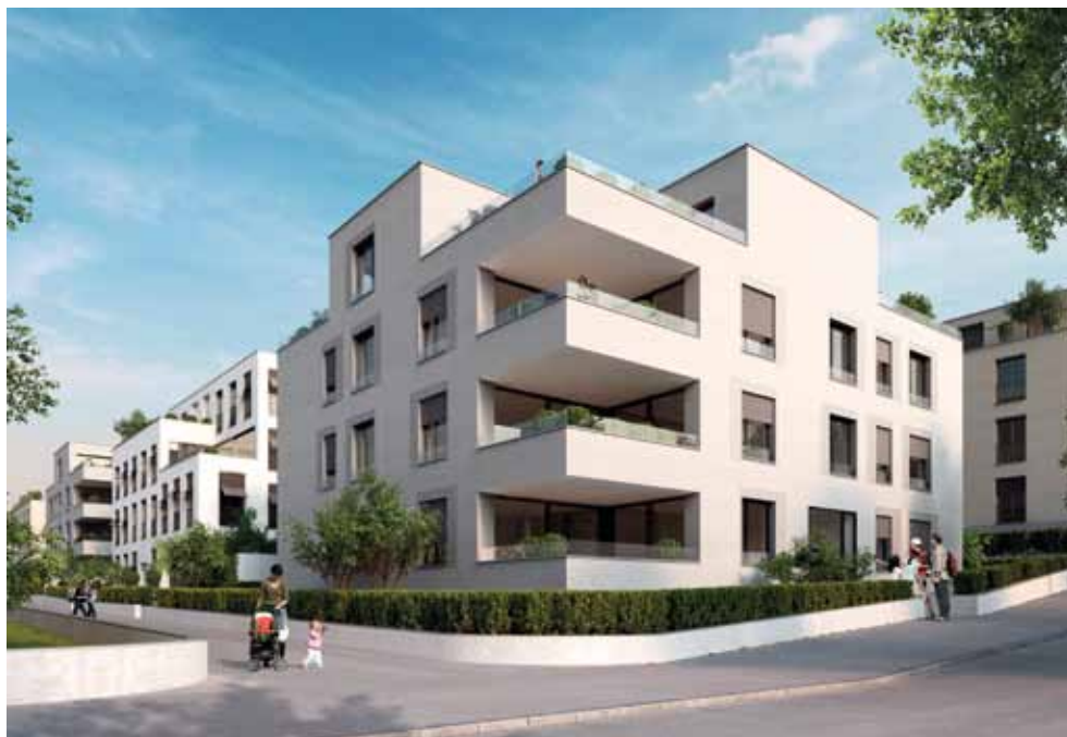
Baufeld B (Visualisierung: STEINER AG, Immobilien Entwicklung)

Die Mietwohnungen mit 2 ½ bis 5 ½ Zimmern sollen im Frühling 2015 bezugsbereit sein. Weitere Informationen sind nach Abschluss des laufenden Baubewilligungsverfahrens ab voraussichtlich Frühling 2013 bei der Regimo Bern AG, Telefonnummer 031 350 50 80 oder cem.tanimis@be.regimo.ch erhältlich.