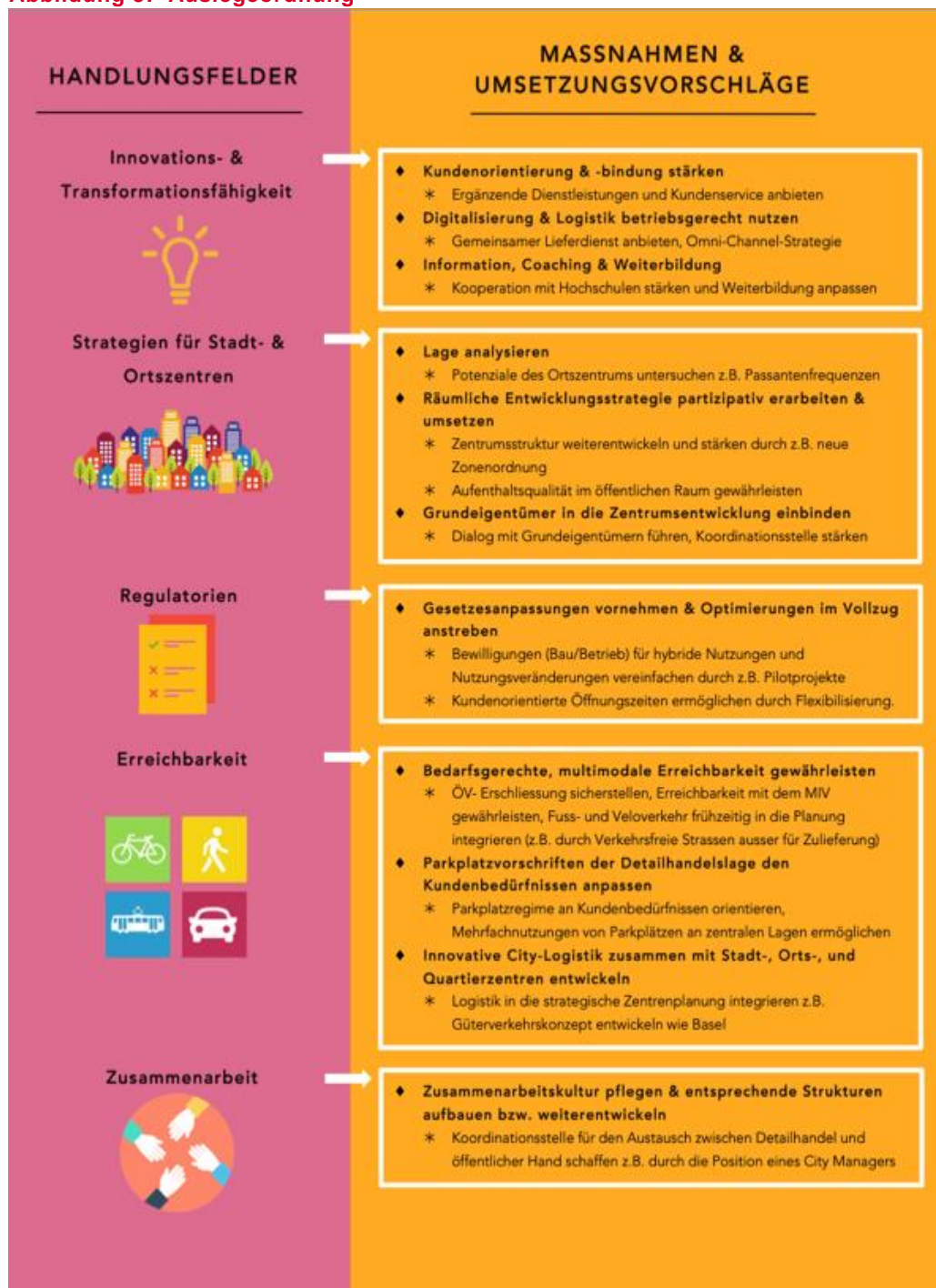
Abbildung 3: Auslegeordnung

Das Spektrum der Handlungsfelder und Massnahmen wurde schrittweise diskutiert, präzisiert und reduziert. Durch das gesammelte Feedback aus den Workshops und der Online-Umfrage konnten konkrete Massnahmen für den Detailhandel in der Innenstadt Bern erarbeitet werden (siehe Abb. 3). Die Online-Umfrage bot zudem die Möglichkeit, die Mitglieder des Begleitgremiums zu den aktuellen Auswirkungen der Corona-Krise zu befragen.